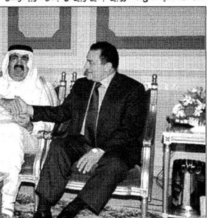
الملك فهد بن عبد العزيز آل سعود مع سفير دولة فلسطين بالقاهرة زهدي القنبري.

وقد قال سفير دولة فلسطين بالقاهرة زهدي القنبري: لا يسعنا إلا أن نرحب ونشجع ما تم التوصل إليه بالمملكة وبوساطة خادم الحرمين الشريفين الملك فهد بن عبد العزيز آل سعود من مصالحة مصرية قطرية بعد فترة من التوتر في العلاقات الثنائية التي اتتكررت بين البلدين، وبين كل البلدان العربية، ونحن