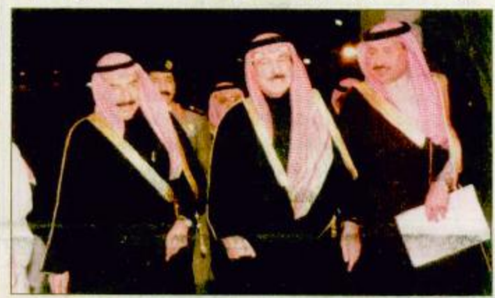
الأمير سظام يفتتح فعاليات ندوة تأثير ظاهرة ابيضاض الشعاب المرجانية

الرياض-عبد الرحمن المصبيح: تلبية عن صاحب السمو الملكي الأمير سلطان بن عبدالعزيز أمير منطقة الرياض وعرض مجلس إدارة الهيئة الوطنية لحماية الحياة الفطرية وإنمائها رعى مساء أمس صاحب السمو الملكي الأمير سظام بن عبدالعزيز نائب أمير منطقة الرياض بقاعة الحضرات بقصر الهيئة فعاليات الندوة الدولية حول مدى تأثير ظاهرة ابيضاض الشعاب المرجانية في المنطقة العربية. وكان في استقبال سموه لدى وصوله إلى مقر الهيئة معالي وزير الشؤون البلدية والقروية عضو مجلس إدارة الهيئة الوطنية لحماية الحياة الفطرية الدكتور محمد إبراهيم الجارالله والأمين العام للهيئة الوطنية لحماية الحياة الفطرية وإنمائها الدكتور عبدالعزيز حامد أبو زنادة والدكتور نزار بن إبراهيم توفيق رئيس مصلحة الأرصاد وحماية البيئة الأمين العام للمنظمة الإقليمية لحماية البحر الأحمر وخليج عدن وعدد من السؤولين في الهيئة. «طلع ص»