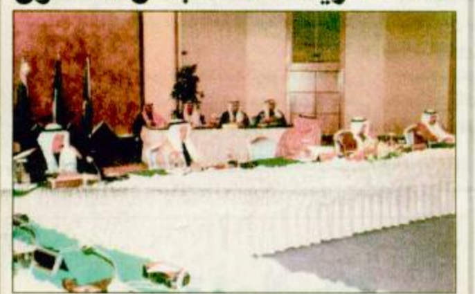
جانب من اجتماع الهيئة الاستشارية بالرياض

الرياض-صالح الفالح: تسلمت المملكة العربية السعودية ورئاسة الهيئة الاستشارية للمجلس الأعلى لمجلس التعاون لدول الخليج العربية وقد تم إعلان ذلك خلال اجتماع الهيئة الاستشارية للمجلس الأعلى صباح أمس بقصر المؤتمرات بالرياض بحضور الأمين العام لمجلس التعاون لدول الخليج العربية الأستاذ جميل الجليلان (30) عضواً يمثلون دول مجلس التعاون الست. وقد تسلم رئاستها معالي وزير المالية الأسبق الأستاذ محمد أبو الخليل. «التفاصيل ص ٢٣»