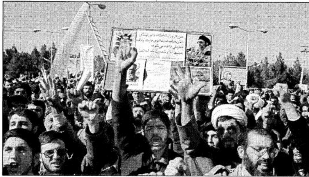
٠ قم - إيران (أ.ف.ب):

متظاهرون إيرانيون في مدينة قم يطالبون باستقالة وزير الثقافة عطا الله مهاجراني بعدما اتهم بتعاونه مع أمريكا.