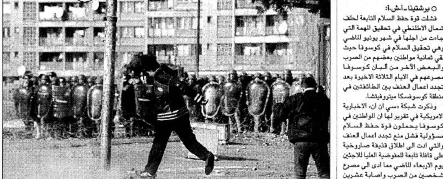
٠ برشتينا - أ.ش.ب:

فشلت قوة حفظ السلام التابعة لحلف شمال الأطلسي في تحقيق المهمة التي جاءت من أجلها من تسفير يورينو للماضي وهي تحقيق السلام في كوسوفا حيث لقي ثمانية مواطنين بعضهم من الصرب والبعض الآخر من ألبان كوسوفا مصرعهم في الأيام الثلاثة الأخيرة بعد تجدد أعمال العنف بين الطائفتين في منطقة كوسوفا ميتروفيتشا. وذكرت شبكة «سي إن إن» الاخبارية الأمريكية في تقرير لها ان المواطنين في كوسوفا يحلمون قوة حفظ السلام مسؤولة قتل منع تجدد أعمال العنف والتي أتت في اطلاق قنبلة صاروخية على قافلة تابعة للمفوضية العليا للاجئين يوم الأربعاء الماضي مما أدى إلى مصرع شخصين من الصرب وإصابة عشرين آخرين وكذلك مقتل ثلاثة من ألبان كوسوفا أمس الأول في أعمال متفرقة بالإضافة إلى حوادث أخرى أسفرت عن وقوع قتلى وجرحى بين المواطنين. وأضافت الشبكة ان المواطنين في منطقة ميتروفيتشا قد حشوا القوة الفرنسية التي تتولى مهمة حفظ السلام في المدينة على فرض حظر التجول لمنع سيطرة القوة على الأوضاع الأمنية ومنع تجدد أعمال العنف وهو ما بدأ تنفيذه بالفعل اعتبارا من ليلة قبل يومين. وفي جنيف أعلنت رئيسة المفوضية العليا للاجئين التابعة للأمم المتحدة سادكو أن قواتها لم يشككون بمشروعية الاجراءات.