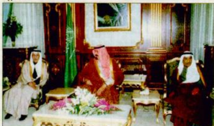
الأمير عبدالله بن عبدالعزيز يستقبل أعضاء الهيئة الاستشارية لقادة مجلس التعاون

الرياض-واس: استقبل صاحب السمو الملكي الأمير عبدالله ولي العهد ونائب رئيس مجلس الوزراء ورئيس الوطني في مكتب سموه في الديوان الملكي بقصر اليمامة أمس رئيس أعضاء الهيئة الاستشارية للمجلس الأعلى لمجلس التعاون لدول الخليج العربية بتقديمهم رئيس الهيئة معالي الأستاذ محمد بن علي أبو الخليل. وفي بداية المقابلة رحب صاحب السمو الملكي الأمير عبدالله بن عبدالعزيز بالجميع في بلدهم الثاني المملكة العربية السعودية مثنياً على جهودهم قائلًا: «أرحب بكم في المملكة ونحن نجمع بكم على الخير وعلى خدمة الدين والوطن وقد بلغني الأخ