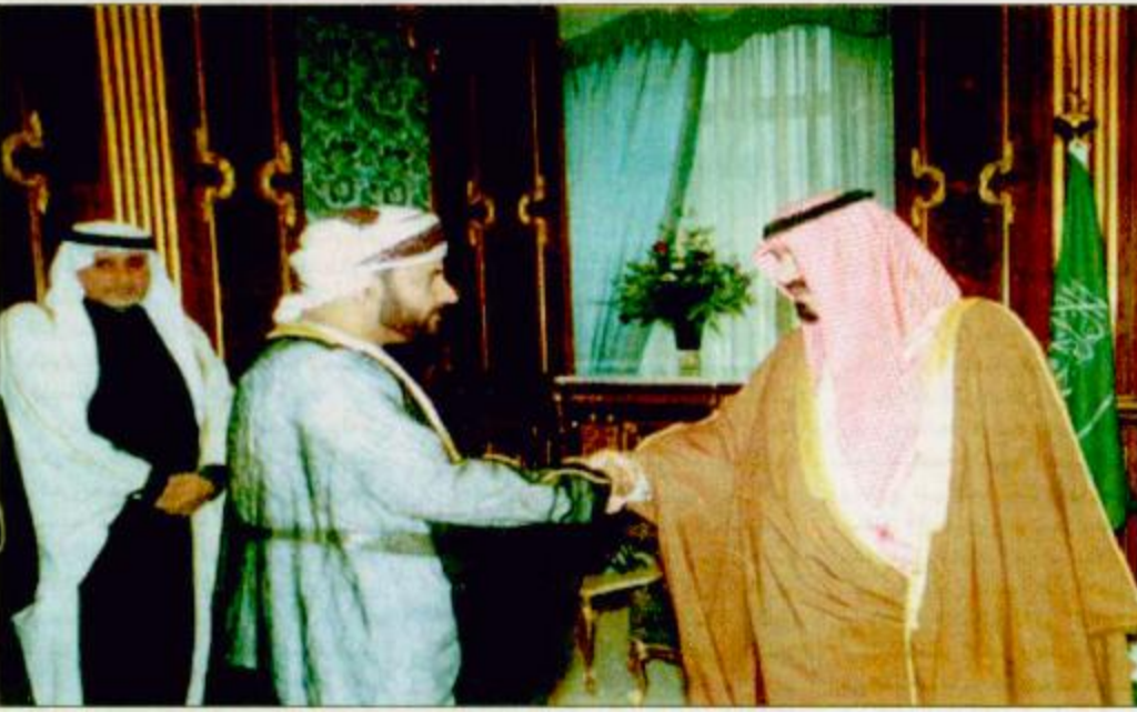
□ الصور من واس □