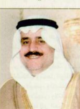
الأمير نايف بن عبدالعزيز

الرياض-محمد السنيدي: يترعى صاحب السمو الملكي الأمير نايف بن عبدالعزيز وزير الداخلية حفظه الله حفل افتتاح المؤتمر السابع لمديري شرطة المناطق بالمملكة مساء اليوم الأحد (10/30/1420هـ) الساعة العاشرة مساءً بقصر الأمن العام بالناصرية بحضور صاحب السمو الملكي الأمير محمد بن نايف بن عبدالعزيز مساعد وزير الداخلية للشؤون الأمنية. وذكر سعادة مدير الأمن العام الفريق أسعد بن عبدالكريم الفريخ: أن تشريف سمو وزير الداخلية ليهيئ الأمن العام برعاية المؤتمر السابع تحت عنوان «الأمن مسؤولية الجميع» يمثل دفعة قوية من معطيات قيادتنا الرشيدة لحفز القيادة الميدانية وتشجيعهم لرفع مستوى أدائهم وأداء البقية ص ٢٩.