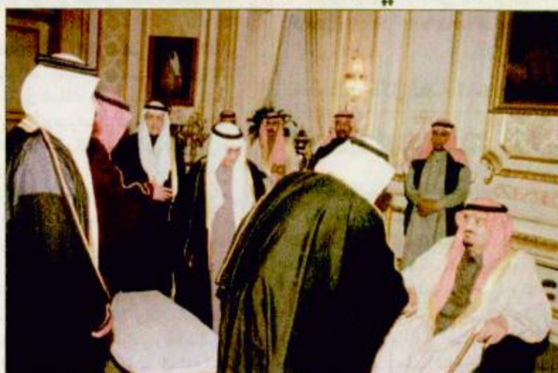
خادم الحرمين الشريفين لدى استقباله أعضاء الهيئة الاستشارية لقادة مجلس التعاون

الرياض-واس: تسلم خادم الحرمين الشريفين الملك فهد بن عبدالعزيز آل سعود رسالة من أخيه جلالة الملك محمد السادس ملك المملكة المغربية الشقيقة، وقام بتسليم الرسالة لخادم الحرمين الشريفين معالي وزير الشريعة والرياضة في المملكة المغربية أحمد السلاوي خلال استقبال الملك للفدى له في مكتبه بقصر اليمامة أمس. كما نقل معاليه لخادم الحرمين الشريفين تحيات البقية ص ٢٩.