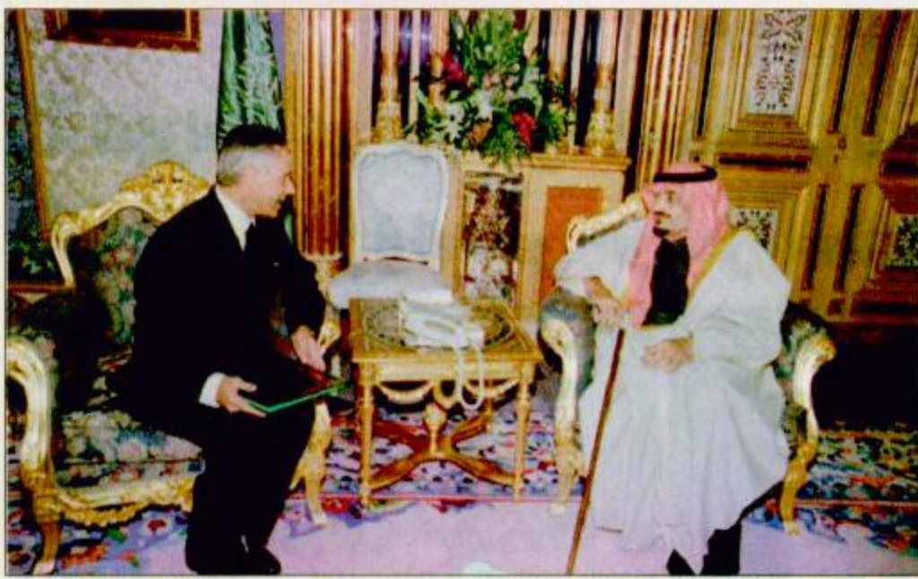
○ خادم الحرمين الشريفين يستقبل أعضاء الهيئة الاستشارية بدول مجلس التعاون □ الصور من واس □