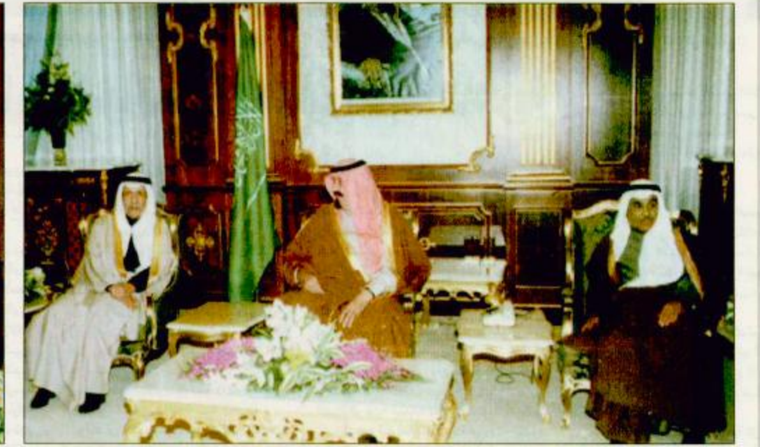
○ استقبال ولي العهد لأعضاء اللجنة الاستشارية لدول مجلس التعاون □ الصور من واس □