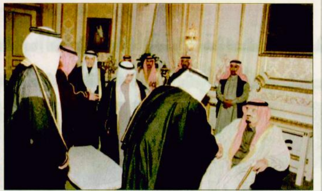
○ خادم الحرمين الشريفين خلال استقباله وزير الشبيبة والرياضة المغربي