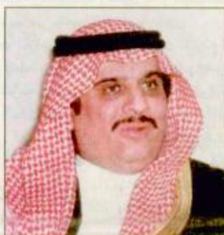
الأمير سلطان بن فهد

الرياض-واس: انتخبت الجمعية العمومية للاتحاد الرياضي للتضامن الإسلامي بالأحماج أمس صاحب السمو الملكي الأمير سلطان بن فهد بن عبدالعزيز الرئيس العام لرعاية الشباب رئيس اللجنة الأولمبية العربية السعودية رئيساً للاتحاد الرياضي للتضامن الإسلامي وذلك خلال جلسة العمل الأولى للجمعية العمومية التي عقدت مساء أمس في قاعة المؤتمرات بمجمع الأمير فيصل بن فهد الأثلي بالرياض برئاسة النائب الأول للاتحاد (الأميني كيتا). «طلع ص»