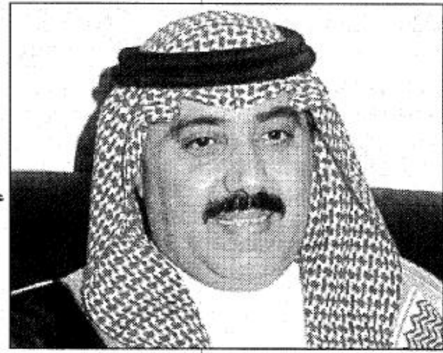
○ الأمير مبعب بن عبد الله ○

الكلمة الموجزة في شموليتها التي أدلى بها صاحب السمو الملكي الأمير متعب بن عبدالله بن عبدالعزيز آل سعود حول مهرجان الجنادرية لهذا العام كانت على محرابين أحدهما بطرح انطباعات مقابلي لها على النحو التالي: