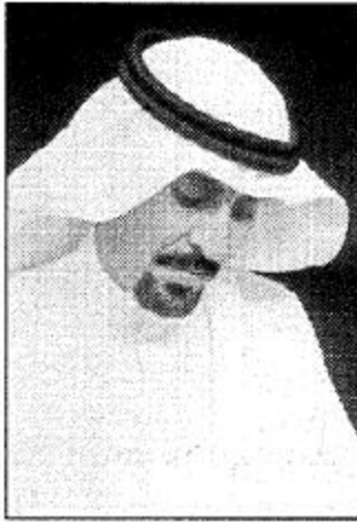
○ أحمد الناصر الأحمد

تفاعلاً مع الحدث الذي تعيشه بلادنا هذه الأيام كتب الشاعر سرور المطيري بعض ما استوحاه من مهرجان الجنادرية أن يقول: