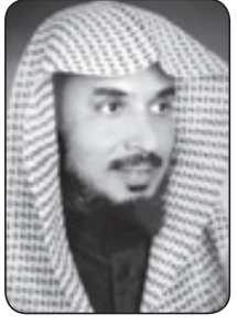
معتق بن عبد الرحمن العتيق

الرحيم بتلمس احتياجات شعبه ويفنفاها كما امتدت أفعاله النبيلة إلى خارج حدود الوطن من خلال ترؤسه للعديد من اللجان الخيرية التي قدمت العون والدعم للعديد من الأشقاء في الوطن العربي والإسلامي. رحمك الله يا خادم الحرمين، لقد وعدت فأوفيت رحمك الله أيها الملك الإنسان فقد جعلت