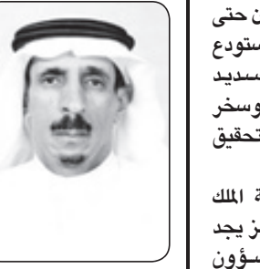
محمد بن سعد بن صالح

المستفيدين منه وصرف إعانة شهرين للمعاقين مع ضم قوائم الانتظار للمعاقين ودعم الجمعيات الرخصه بملياري ريال، والأهمية أسكن للمواطنين فقد صدر أمر الكريم بتخصيص ٢٠ مليارا لتفنيذ خدمات الكهرياء والمياه من أجل الإسراع بتطوير المخططات السكنية. ومن أجل حل قضية التأخر في اتخاذ القرارات صدرت الأوامر بإلغاء الكثير من الجالس وتوحيدها في مجلسين فقط هما مجلس للشؤون السياسية والأمنية ومجلس للشؤون الاقتصادية والتنمية حيث يعكس القرار الرؤية الجديدة نحو معرفة مكان تأخر الكثير من القرارات والعمل على إصلاحها للتوافق من سمة العصر الحديث المتسارع في قضاياها، فإلغاء العديد من الجالس العليا المتعددة هو أاد لبيروقراطية اتخاذ القرار نحو سرعة اتخاذ القرار وإنجاز للعديد من المشاريع والبرامج. ولان للشباب