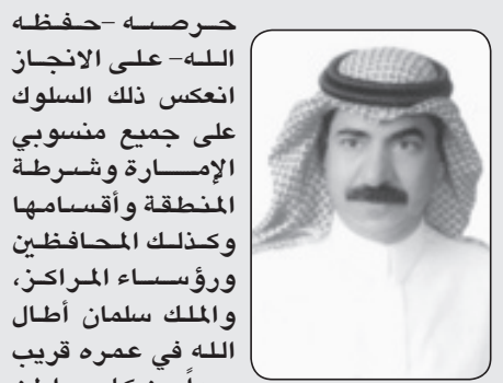
إبراهيم بن محمد السيارى

مختلف مهامها وهو دائماً يترجم الأقوال بالأفعال، وعندما تولى مقاليد الحكم على البلاد صار بلا شك خير خلف لخير سلف، وأول ما فكر به هو إسعاد شعبه حينما وجه -أطال الله في عمره- بتلك التوجيهات والتي منها زيادة مخصصات الضمان الاجتماعي وراتبان للموظفين والمتقاعدين ولم يبال بتلك المكارم بالرغم من نزول أسعار النفط حيث انهمرت مكارمه على كل مواطنيه كالمنظر واستبشرت بها كل طبقات الشعب كما أنه -حفظه الله- قد وفق في اختيار دماء جديدة من الوزراء والقيادات الأخرى لرغبته الأكيدة في خدمة الناس. تتشرف بالولاء والطاعة ونبارك لأنفسنا ولكافة أفراد الشعب السعودي بهذا الملك الهمام، المحب لشعبه ندعو الله له ولحكومته الرشيدة بالتوفيق والسداد.. والله ولي التوفيق..