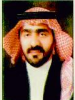
عبدالله بن راجح المالكي

اليوم وفي منطقة الباحة يتجدد اللقاء بصاحب السمو الملكي الأمير عبدالله بن عبدالعزيز آل سعود ولي العهد ونائب رئيس مجلس الوزراء ورئيس الحرس الوطني بعد أن كان بالأمس في مكة المكرمة وقبلها في منطقة عسير يتفقد أحوال المواطنين ويتحسس احتياجاتهم ويعمل على تحقيقها وفق توجيهات مولاي خادم الحرمين الشريفين حفظه الله ومن منطلق حرص سموه الكريم واهتمامه الدائم باحتياجات المواطنين والعمل على حلها. ويلا شك فإن هذا اليوم الذي تستقبل فيه منطقة الباحة ضيفها الكبير والغالي صاحب السمو الملكي الأمير عبدالله بن عبدالعزيز آل سعود حفظه الله يعد من الأيام المضيئة في تاريخ منطقة الباحة لذا فإن الجميع هنا في المنطقة يتسابقون على تقديم كل ما يستطيعون تقديمه والاسهام به في هذا اليوم التاريخي والجميع هنا يريد التعبير عما يكنه قلبه تجاه حكومتنا الرشيدة. وإن السعادة لكبيرة وملاحها ارتسمت على الوجوه وتعانقت القلوب مع صاحب القلب الكبير ولي العهد الأمين الذي لم يبخل على شعبه ووطنه بجهده وماله ووقته فجنى من شعبه الحب الكبير والولاء الدائم والترحيب الوافر فمرحباً أبا متعب وجعل الله أعمالك في موازين حسناتك ولن نوفيك سيدي حقه من سرد المحاسن فانت تأجها وكل ما نستطيع قوله هو أن ندعو الله عز وجل ان يحفظ لهذه البلاد أمنها واستقرارها في ظل قيادة مولاي خادم الحرمين الشريفين وسمو ولي عهد الأمين وسمو النائب الثاني وحكومتهم الرشيدة إنه سميع مجيب.