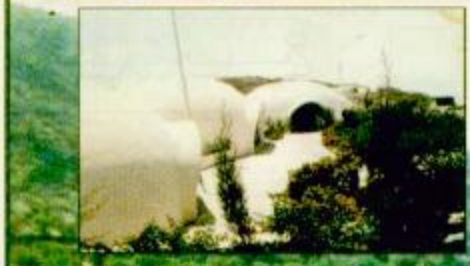
إعداد: عبدالله بن راجح المالكي / أحمد عزيز الغامدي - بيئنا مؤسسة الجزيرة للصحافة والاعلام مناخية، قسم الملاحق الصحفية