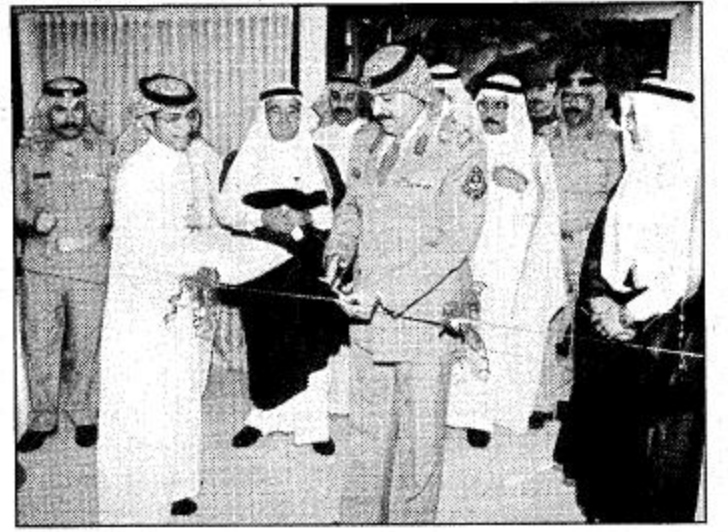
الرياض - صالح الصعبي:

افتتح صاحب السمو الملكي الأمير الفريق الراكع بن عبد العزيز نائب رئيس الجهاز العسكري بالحرس الوطني وقائد كلية الملك خالد العسكرية صباح أمس الثلاثاء، فعاليات الندوة العالمية للتحديات الحديثة في أمراض وزراعة الكلى بنشادي ضباط الحرس الوطني بالرياض وعبر سموه في كلمته عن أمله في أن تفتح الندوة آفاقاً جديدة في مجال أمراض وزراعة الكلى خصوصاً وأنها تحظى بمشاركة العديد من الأسماء المعروفة والمشهد لها بالكفاءة والخبرة عالمياً ومحلياً.