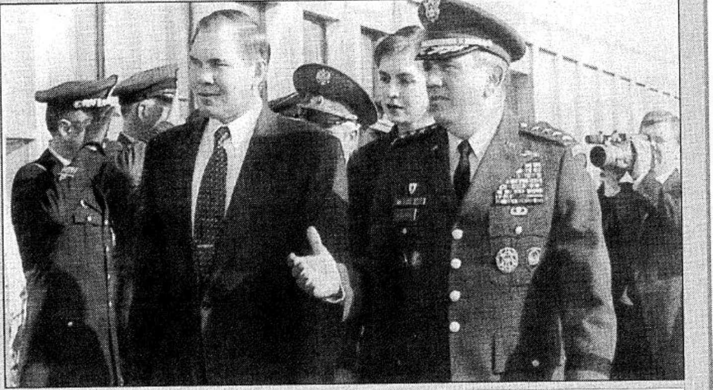
كاستو بليجكا جنرال الكسندر لبيد أمين عام مجلس الأمن القومي الروسي يرافقه القائد الأعلى لقوات تحالف الناتو في أوروبا جنرال جورج جولان من الولايات المتحدة، يتفقان حرس الشرف الذي اصطف تحية لبيد أثناء زيارته للمقر الرئيسي لقوات الناتو في كاستو بليجكا يوم الثلاثاء الماضي.