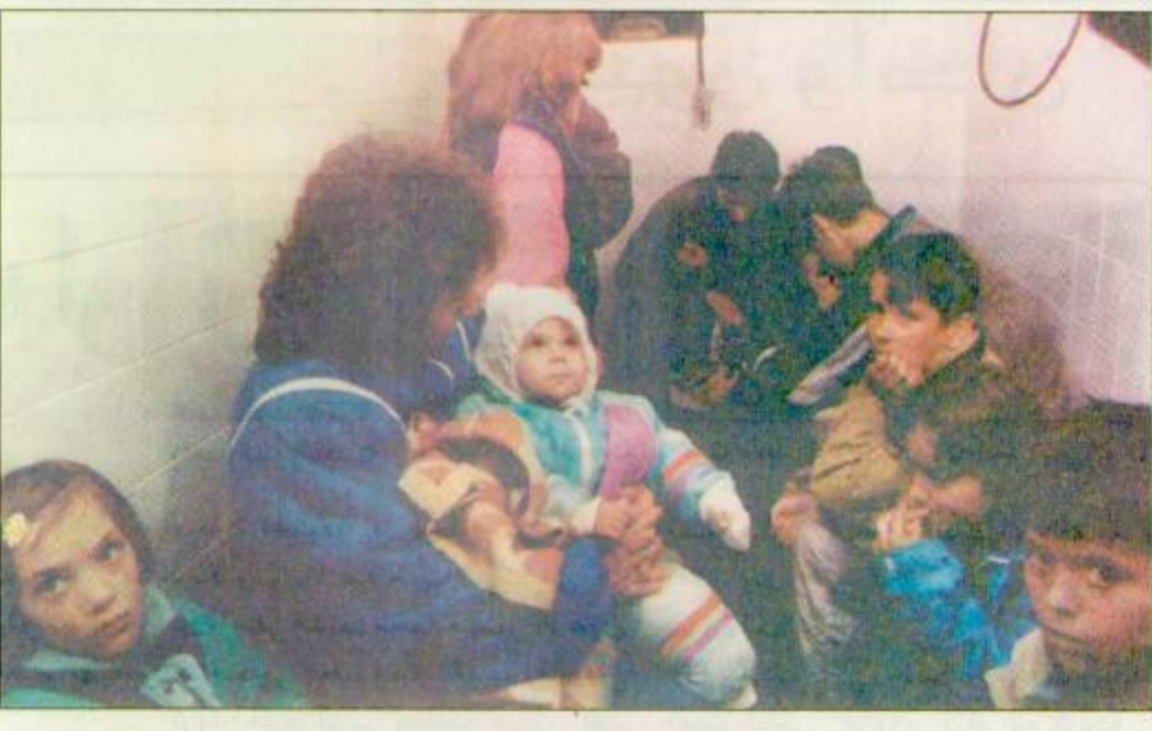
بالي - البوسنة والهرسك: امرأة صربية بوسنية وبعض الاطفال ينتظرون في تونس الماء الذي اعطيت انتهاء الموعده النهائي الخدم لضربات الناتو الجوية في حجرة بالطابق الارضي من المنزل في مدينة بالي (أ.ف.ب)

بروكسل - سراييفو - انقره - الوكالات. أكد مسؤولون من الأمم المتحدة في البلقان انه ليس هناك ما يدل على انسحاب صربي واسع النطاق من حول العاصمة البوسنية سراييفو. وفي تزامن مع هذا الاعلان الذي يؤكد احتلال صرب البوسنة بشروط وقف الغارات التي يشنها حلف شمال الأطلسي (الناتو) اعلم مصدر في حلف شمال الأطلسي في بروكسل امس الثلاثاء ان الحلف استأنف ضرباته الجوية ضد مواقع صربية في البوسنة.