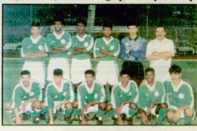
جدة - واس:

مسقط - الجزيرة: حقق منتخبنا الوطني للشباب اول فوز في افتتاح مبارياته بدورة الصداقة الخامسة للشباب بعد تجاوزه المنتخب البحريني الشقيق بدهنين مقابل هدف واحد.