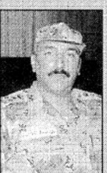
العميد عبد الرحمن الشريف

الساحلية بالمملكة وإذا كان الاستثمار على هذه الشواطئ فهو ناجح 100% بمشية الله وسيكون الاقبال منقطع النظير.