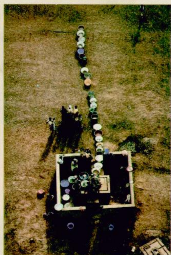
الما مورد على طريق الزوال