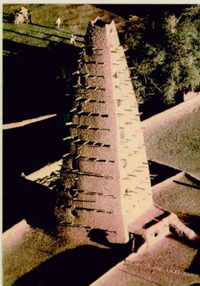
مئذنة المسجد الكبير في أبادير