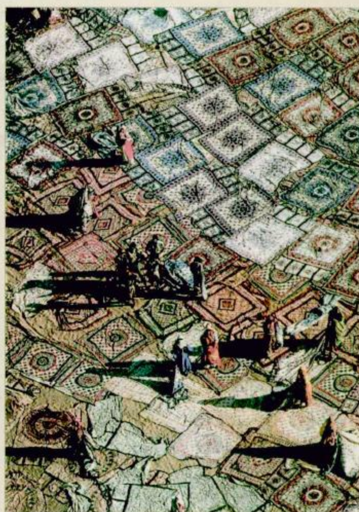
قطيات تجف تحت الشمس «راجستان الهند»