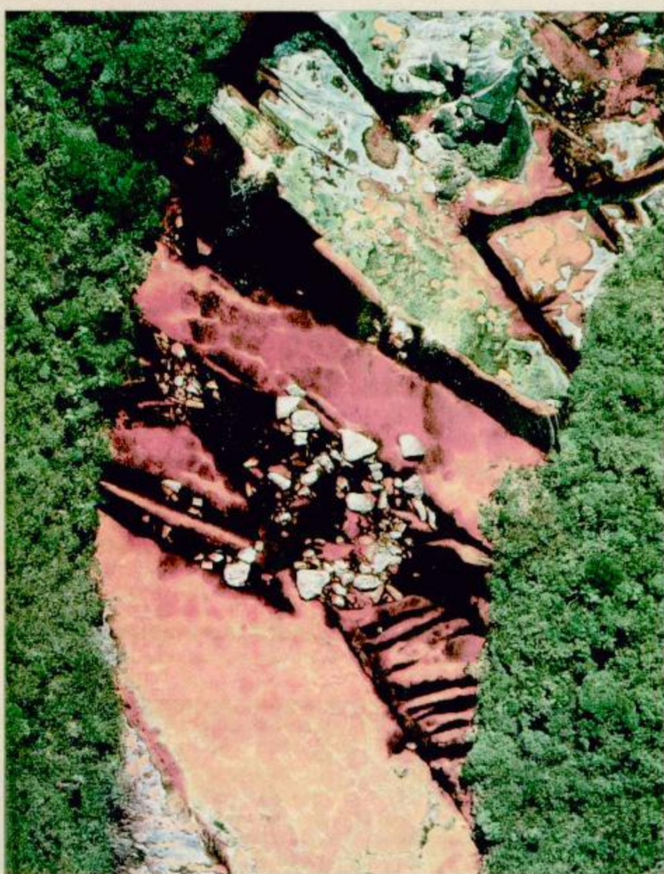
نهر أوبان يتجوى - منطقة غران سابانا