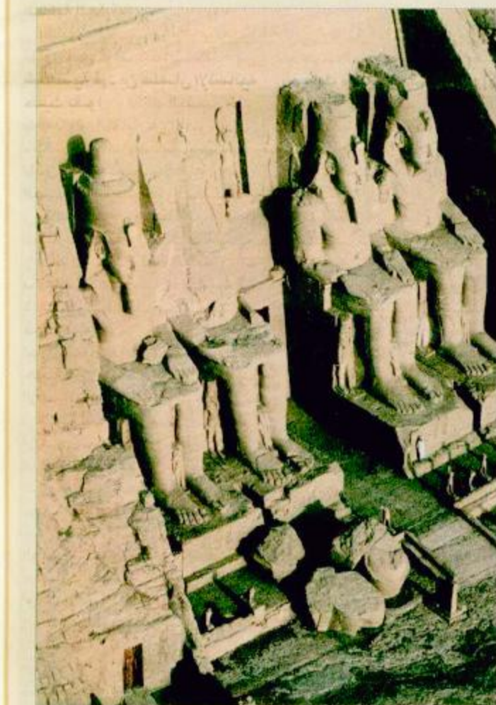
معبد أبو سمبل وادي النيل

عبدالعزیز العامة بالإطلاع على هذا المعرض، ومن ثم رفعت المكتبة تصوراً لصاحب السمو الملكي الأمير عبدالله بن عبدالعزيز ولي العهد، نائب رئيس مجلس الوزراء ورئيس الحرس الوطني والرئيس الأعلى لمجلس إدارة المكتبة عن فكرة المعرض وأهمية المصور وأن هذه الصور أو هذا الكتاب العالمي «الأرض من السماء» يحتوي على جميع صور العالم ما عدا المملكة وطلبت المكتبة إقامة المعرض في مناطق المملكة ويبدأ بمشيئة الله في مدينة الرياض بمناسبة إقامة المهرجان الوطني التاسع عشر للتراث والثقافة. عقب ذلك تم طلب موافقة سموه الكريم على طلب المصور العالمي يان أرتوس برتران لكي يتم تصوير بعض مناطق المملكة من السماء، وتحمّد الله على موافقة