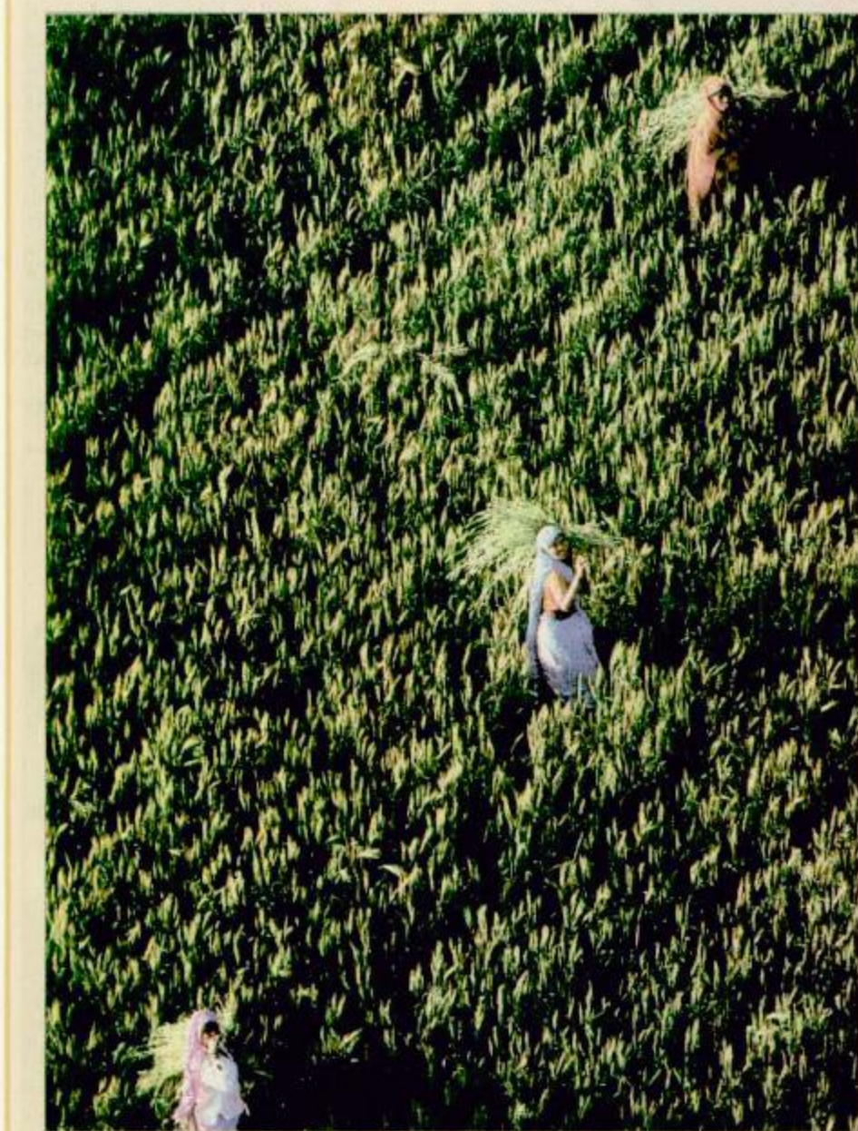
حصار القمح في منطقة ماثور