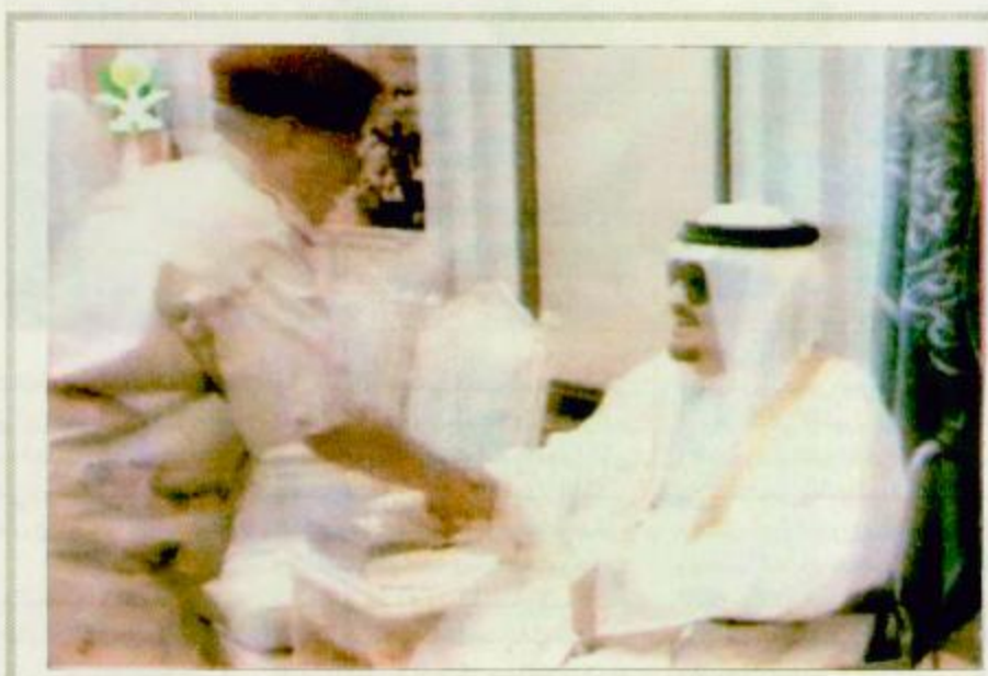
خادم الحرمين يستقبل الأمراء والعلماء والوزراء وقادة وضباط أمن الحج ص «٢»

منى - واس: وجه خادم الحرمين الشريفين الملك فهد بن عبدالعزيز آل سعود وصاحب السمو الملكي الأمير عبدالله بن عبدالعزيز آل سعود ولي العهد ونائب رئيس مجلس الوزراء ورئيس الحرس الوطني كلمة إلى المواطنين والأمة الإسلامية بمناسبة عيد الأضحى المبارك لعام 1417هـ. وقد تشرف بالقائها عبر الإذاعة والتلفاز معالي وزير الإعلام الدكتور فؤاد بن عبدالسلام الغارسي. وفيما يلي نص الكلمة: الحمد لله رب العالمين.. والصلاة والسلام على خاتم الأنبياء والمرسلين، سيدنا محمد بن عبدالله وعلى آله وصحبه ومن اتبعه باحسان إلى يوم الدين. أيها الأخوة المواطنين.. أيها الأخوة حجاج بيت الله الحرام.. السلام عليكم ورحمة الله وبركاته وبعد.. بمناسبة حلول عيد الأضحى المبارك نهنئكم أجمل تهنئة منتهلين إلى الله العلي القدير أن يجعله عيداً مباركاً علينا جميعاً وأن يعيده على بلادنا العزيزة باليمن والبركات وعلى الأمة الإسلامية وقد تحققت كل أمنياتها العالية وأهدافها الحيرة في المزيد من التعاون والتضامن في ظل ديننا الإسلامي الحنيف. ومع أشراقة صباح هذا اليوم الأغر، عيد الأضحى المبارك الذي يحتفل به المسلمون في مشارق الأرض ومغاربها نكرر التحية بخواننا ضيوف الرحمن الذين وفقنا الله للسور على راحتهم لكي يؤدوا نسكهم في أمن وأطمئنان واجين لهم حجاً مبروراً وسعياً مشكوراً وعباداً حميداً إلى ديارهم. وفي هذه المناسبة المباركة نسال الله العلي القدير أن يكال جودنا بالتوفيق لنواصل بإن الله تنفيذ كل ما عقدنا العزم على تنفيذه البقية «ص21»