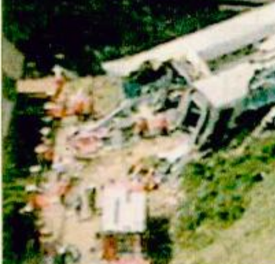
منظر يجسد الدمار الذي أحدثه اصطدام القطار «تفاصيل أخرى ص ٣٠»