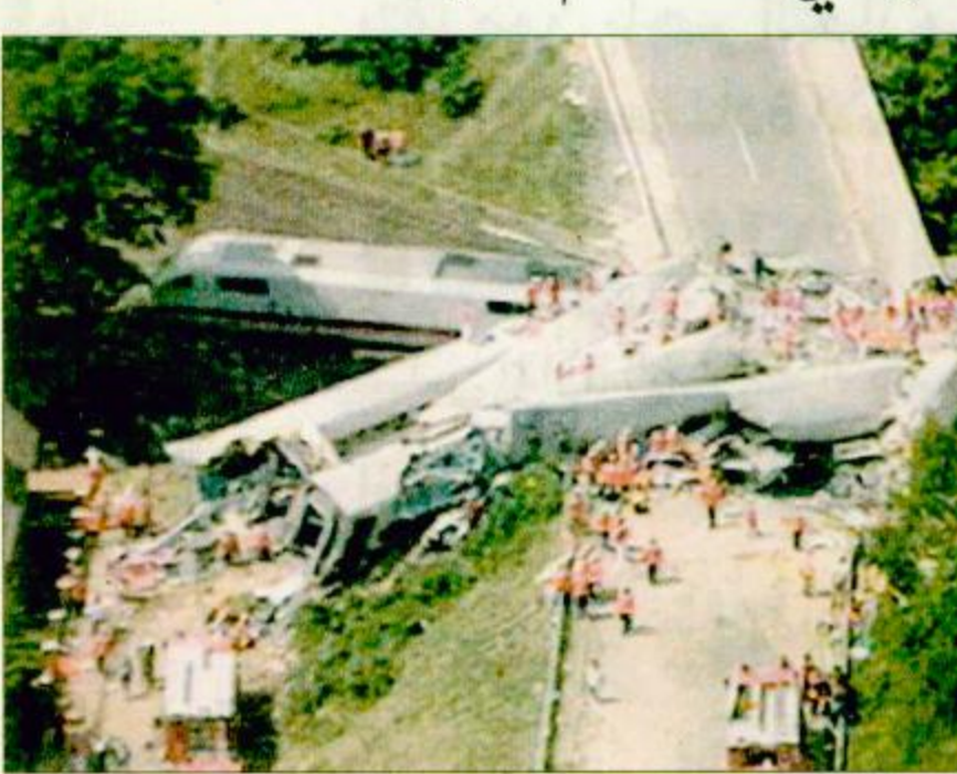
منظر يجسد الدمار الذي أحدثه اصطدام القطار (رويترز) «تفاصيل أخرى ص ٣٠»

بشدي ألمانيا - الوكالات: لقي أكثر من مائة شخص بينهم عشرات من أطفال المدارس حتفهم وأصيب نحو ثلاثمائة شخص خمسون إصاباتهم خطيرة أمس الأربعاء في حادث قطار خرج عن القضبان وارتطم في جسر عده المراقبون أسوأ كارثة قطارات تشهدها ألمانيا منذ نصف قرن. ووقع الحادث قرب محطة إيشيدي في شمال ألمانيا. وقال متحدث باسم حكومة ساكسونيا السفلى ان القطار خرج عن القضبان بعد أن اصطدم بسيارة سقطت من على طريق علوي. البقية، ص ٢٧.