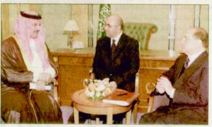
جانب من الاستقبال

استقبل دولة رئيس وزراء إيطاليا سيلفيو بيرلسكوني أمس صاحب السمو الملكي الأمير سعود الفيصل وزير الخارجية. وتم خلال المقابلة بحث أوجه التعاون بين المملكة وإيطاليا وأخر المستجدات على الساحة العربية والدولية.