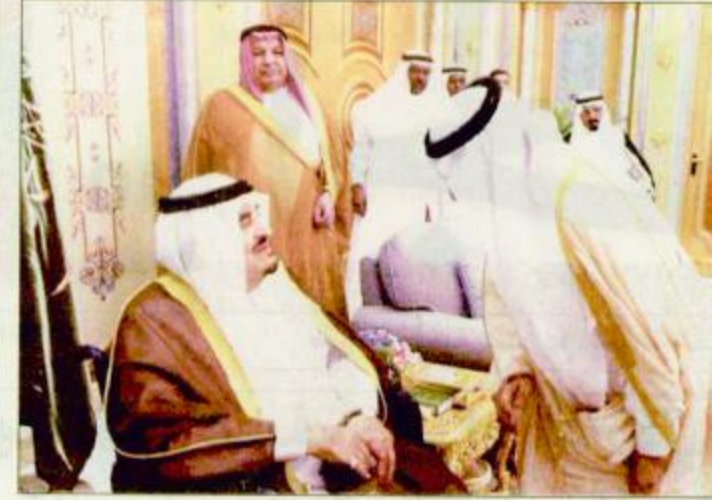
خادم الحرمين الشريفين خلال استقباله لأمراء المناطق

الجزيرة أول صحيفة سعودية تتواجد حول العالم في يوم صدورها