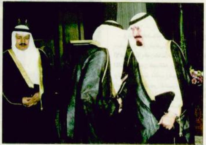
استقبال صاحب السمو الملكي الأمير نايف بن عبدالعزيز وزير الداخلية بمكتب سموه بجدة أمس