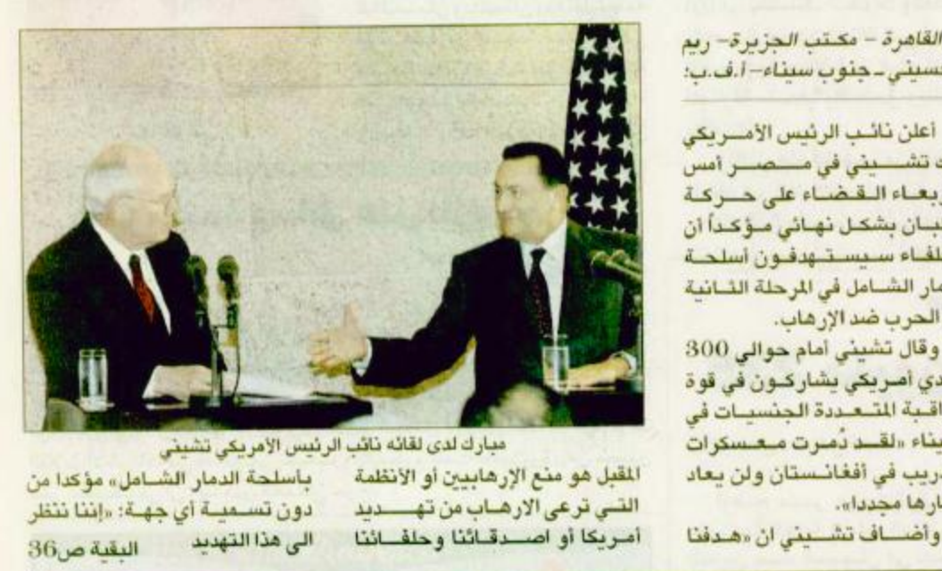
مبارك لدى لقائه نائب الرئيس الأمريكي تشيني

المقبل هو منح الإرياهيين أو الأنظمة بالسلطة الدمار الشامل، مؤكداً من التي ترى الإرهاب من تهديد دون تسوية أي جهة: «إننا نظفر أمريكا أو اصداقائنا وحلفائنا الذي هذا التهديد