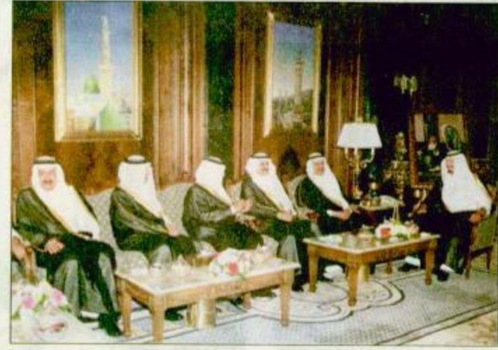
سمو ولي العهد يستقبل أمراء المناطق