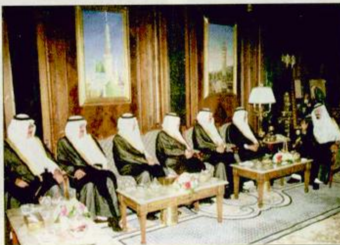
الأمير عبد الله استقبال الأمير نايف وأمرء المناطق

الملكبة الأستاذ محمد آل الشيخ وفائد الحرس الملكي الفريق أول ركن عبدالله النملة ومعالى نائب رئيس الشؤون الخاصة للملكية الأستاذ سعد بن عمار نائب رئيس المكتب الخاص لخادم الحرمين الشريفين الأستاذ سليمان بن الأمير. كما استقبل صاحب السمو الملكي الأمير نايف بن عبدالعزيز ولي العهد نائب رئيس مجلس الوزراء ورئيس الحرس الوطني في قصر سموه بجدة صاحب السمو الملكي الأمير نايف بن عبدالعزيز وزير الداخلية وأصحاب السمو أمراء