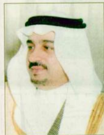
الأمير فيصل بن بندر

السعودية على الظهر بجواز سمو الأمير سلطان بن محمد بن سعود الكبير الفخمة المتمثلة بعدد سبع سيارات، إضافة إلى استلام جوائز التصفيات التمهيدية (الأولية) التي سبق وأن أقيمت بميادين