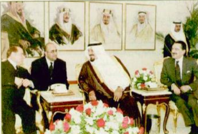
الأمير سلطان في مقدمة مودعي رئيس وزراء إيطاليا