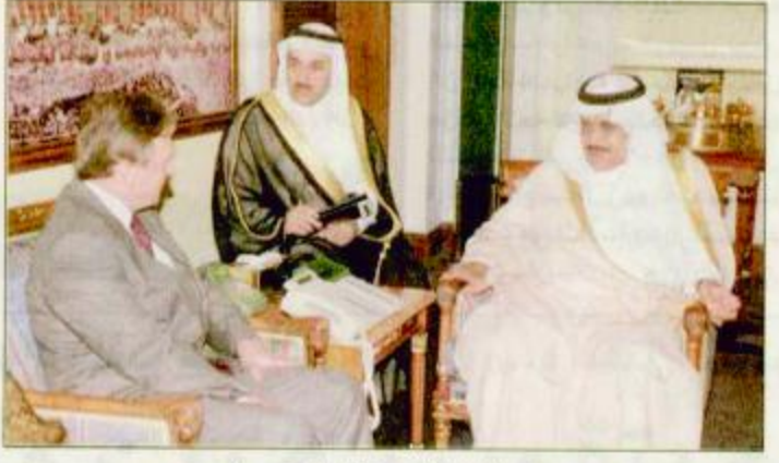
سمو وزير الداخلية يستقبل السفير السعودي

استقبل صاحب السمو الملكي الأمير نايف بن عبدالعزيز وزير الداخلية بمكتب سموه بجدة أمس السفير السعودي لدى المملكة أوكيه كاراسون. وجرى خلال اللقاء تبادل الأحاديث الودية وبحث الموضوعات ذات الاهتمام المشترك بين البلدين الصديقين.