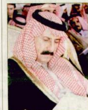
الأمير سلطان بن محمد الفروسية بمنطقة ومحافظات المملكة والبالغ عددها 19 سيارت.

بريدة - بندر الرشودي وعبد الرحمن التويجري: