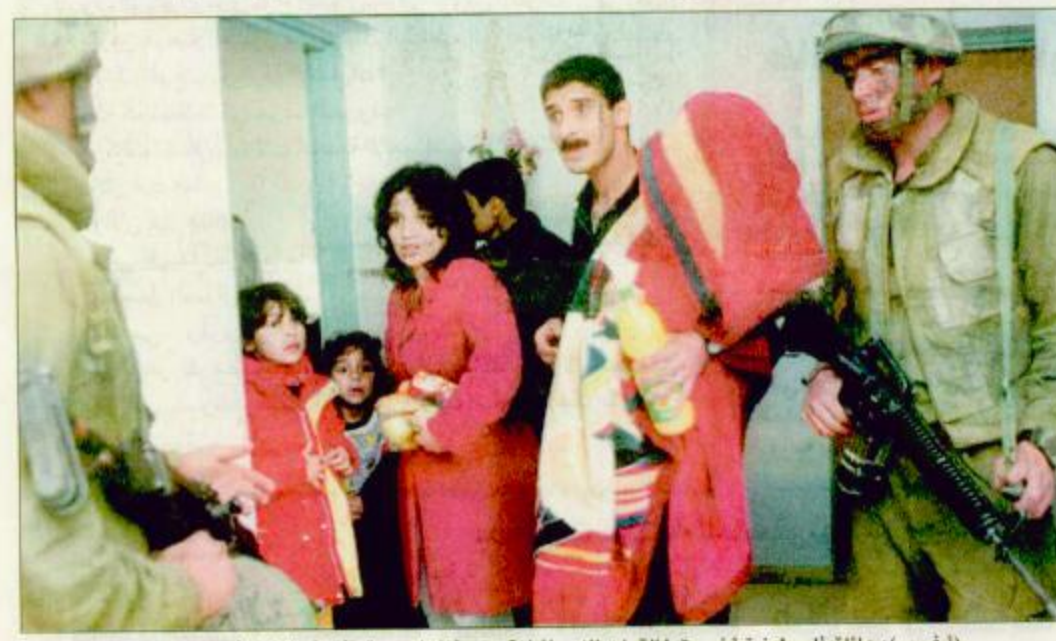
عائلة فلسطينية أخرجها القوات الإسرائيلية من منزلها بحجة تفقد المنزل في رام الله.