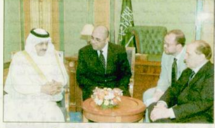
رئيس الوزراء الإيطالي يستقبل الأمير نايف

استقبل دولة سيلفيو بيرلسكوني رئيس وزراء إيطاليا بمقر إقامته بقصر المؤتمرات بمحافظة جدة أمس صاحب السمو الملكي الأمير نايف بن عبدالعزيز وزير الداخلية. وتم خلال المقابلة بحث عدد من الموضوعات ذات الاهتمام المشترك وخاصة في الأمور الأمنية وحضرة الاستقبال صاحب السمو الملكي الأمير محمد بن نواف بن عبدالعزيز سفير خادم الحرمين الشريفين لدى إيطاليا ومعالي وزير الصناعة والتجارة الدكتور