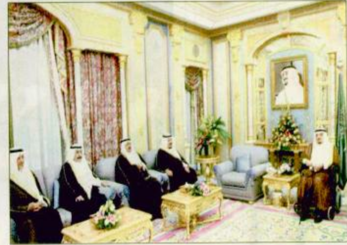
خادم الحرمين لدى استقباله الأمير نايف وأمرء المناطق

استقبل خادم الحرمين الشريفين الملك فهد بن عبدالعزيز آل سعود في مكتبه بقصر السلام أسد صاحب السمو الملكي الأمير نايف بن عبدالعزيز وزير الداخلية وأصحاب السمو أمراء المناطق بمناسبة انعقاد اجتماعهم السنوي الثامن. وقد استمع أصحاب السمو أمراء المناطق إلى توجيهات خادم الحرمين الشريفين الذي أوصاهم بتقوى الله في السر والعلن والسهر على راحة المواطنين وتلمس احتياجاتهم والعمل على قضائها بما يحقق المزيد من الرخاء.