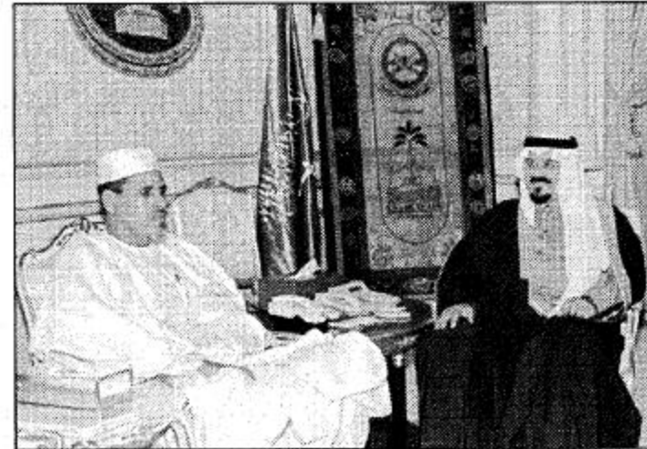
○ سمو النائب الثاني يستقبل مستشار رئيس النيجر ○