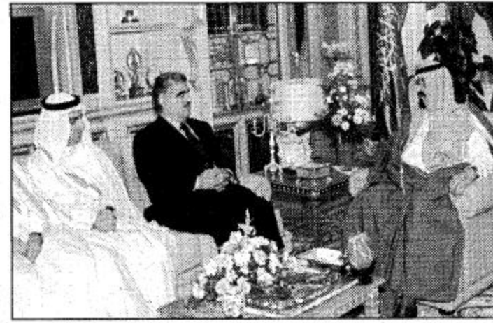
○ سمو ولي العهد يستقبل رئيس وزراء لبنان ○