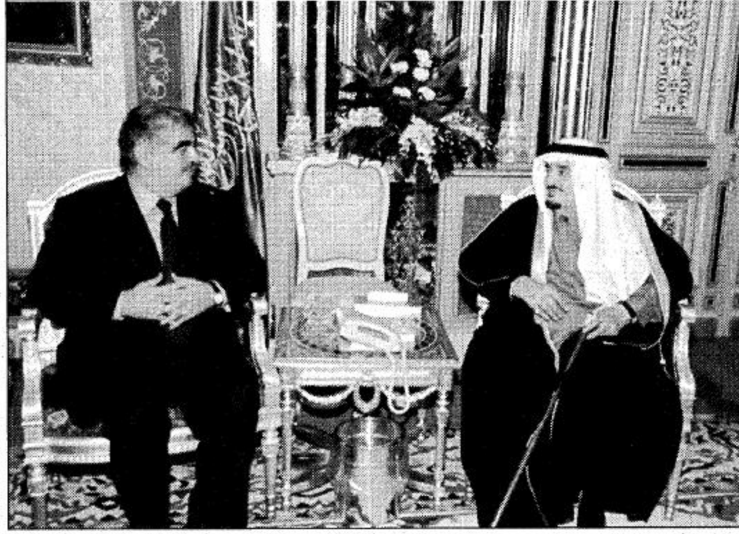
○ خادم الحرمين الشريفين يستقبل رفيق الحريري ○

ونعتقد أن التطورات الإقليمية والعالمية في مختلف المجالات السياسية والاقتصادية خاصة في ظروف النظام العالمي الجديد وقوانين التجارة العالمية، كل هذه الأمور تتطلب وجود الأمانة الدائمة التي اقترحها سمو ولي العهد الأمين للمنتدى العالمي للطاقة، كما نعتقد ويشاركنا الاعتقاد الأطراف المشاركة في هذا المنتدى أن عاصمتنا الرياض هي الأنسب عملياً لتكون مقراً دائماً لهذه الأمانة.