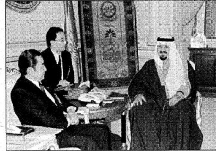
○ سمو النائب الثاني يستقبل رئيس وزراء اليابان ○