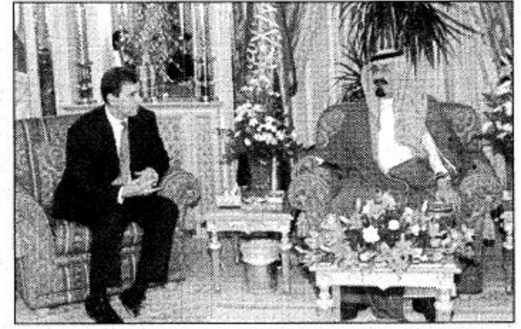
○ سمو ولي العهد يستقبل الأمير اندرو دوق يورك ○