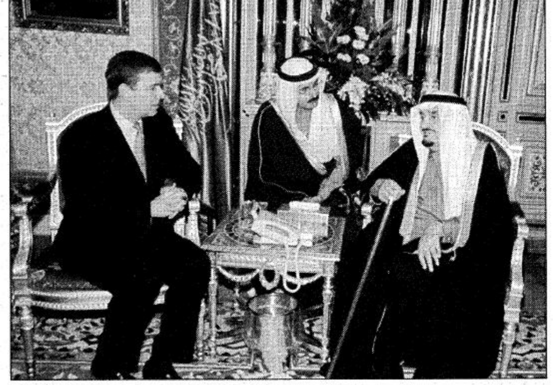
○ خادم الحرمين يستقبل الأمير دوق يورك ○