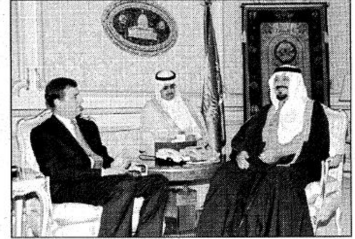
○ سمو النائب الثاني يستقبل الأمير اندرو دوق يورك ○