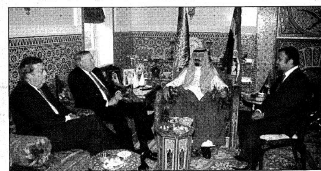
لقطتان من مباحثات سمو ولي العهد مع المسؤولين الأمريكيين

ورئيس الحرس الوطني بمقر إقامة سموه في الولايات المتحدة الأمريكية. بوشنطن امس رؤساء المنظمات الإسلامية بالولايات المتحدة الأمريكية. جرى خلال اللقاء تبادل الاحاديث الودية والاطلاع على اللهام التي تقوم بها هذه المنظمات لخدمة الإسلام والمسلمين في الولايات المتحدة الأمريكية. وحضر الاستقبال الوفد الرسمي الرافق لسمو ولي العهد.