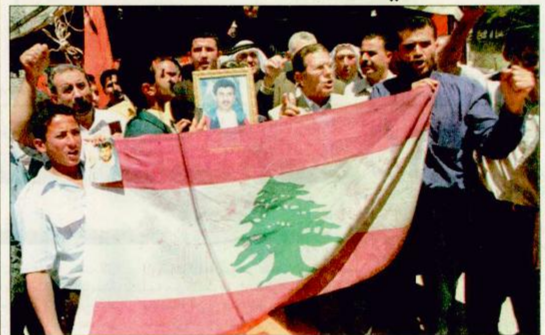
○ الضفة الغربية - أ.ف.ب: فلسطينيون يحملون العلم اللبناني خلال مسيرة احتفالية بالضفة الغربية فرحا بانسحاب إسرائيل من الجنوب اللبناني.