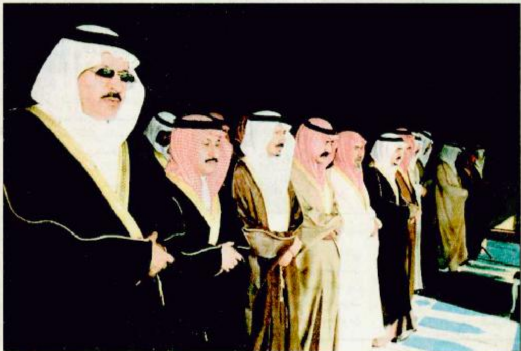
○ خادم الحرمين وعدد من الأمراء يؤمنون صلاة الميت على الأمير مشاري بن عبدالعزيز ○