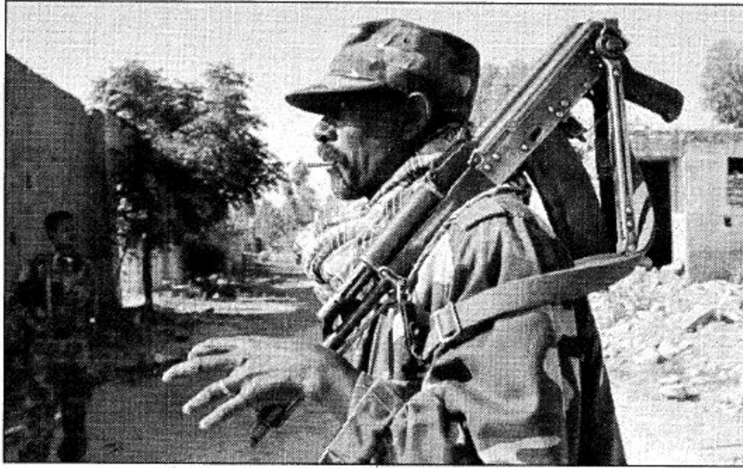
أسيرة إريتريا يجدي إريتري بعشي في شوارع مدينة زانبيسا الواقعة على الحدود بين إريتريا وأثيوبيا حيث أعلنت القوات الإثيوبية أنها استطاعت السيطرة على المدينة.