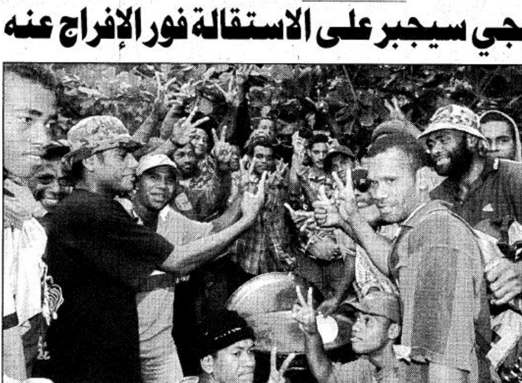
○ سوفا - فيجي: مجموعة من الثوار يرفعون شارة النصر أمام مبنى البرلمان الذي يحتجزون فيه رئيس الوزراء المطروح وعددا من الرهائن.