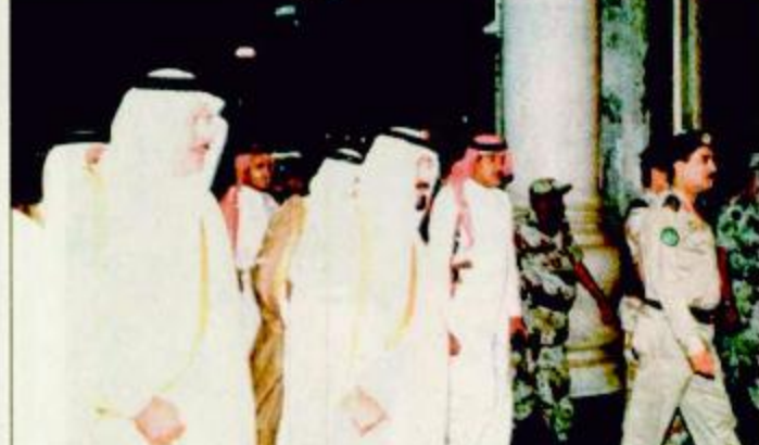
○ سمو ولي العهد يطوف بالبيت العتيق

عبدالعزيز وصاحب السمو الملكي الأمير فواز بن عبدالعزيز وصاحب السمو الملكي الأمير عبدالله بن عبدالعزيز أمير منطقة المدينة المنورة وصاحب السمو الملكي الأمير محمد بن نواف بن عبدالعزيز بقيقة «ص ٣٣»