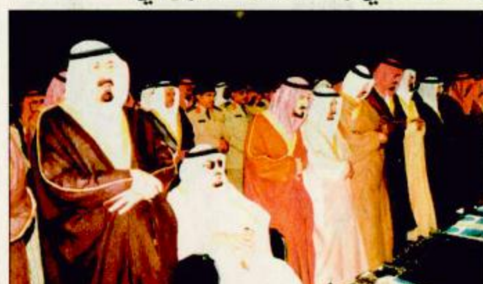
○ خادم الحرمين الشريفين يؤدي صلاة الميت على الأمير مشاري بن عبدالعزيز

الأمير فهد بن محمد بن عبدالعزيز وصاحب السمو الملكي الأمير متعب بن عبدالعزيز وزير الأشغال العامة والإسكان وصاحب السمو الملكي