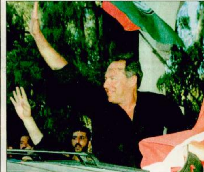
○ لبنان - (أ.ف.ب): الرئيس اللبناني أميل لحود يلوح لأفراد الشعب اللبناني الذين احتشدوا احتفالاً بالنصر على إسرائيل.

○ القدس - جنوب لبنان - الوكالات: أعلنت الحكومة الإسرائيلية أمس الخميس استعدادها للانسحاب من «جزء صغير» من مزارع شعبا التي يطالب بها لبنان، الا انها استبعدت تسليم المنطقة بكاملها إلى الحكومة اللبنانية. وأعلنت وزارة الدفاع الإسرائيلية ان رئيس جاك شيراك انه سيتم إخلاء الجزء الصغير من مزارع شعبا الموجود في الأراضي اللبنانية بحسب خرائط الأمم المتحدة. الا ان الوزارة نفت معلومات أوردتها الاذاعة الإسرائيلية مفادها ان باراك أبلغ شيراك على استعداده للتنازل عن مزارع شعبا بالكامل حتى لا يعطي سوريا أو حزب الله الشيعي الأصولي حجة لواصله هجماتها على إسرائيل بعد انسحابها أمس من جنوب لبنان. وأضافت الوزارة في بيان ان «العلامات التي أشارت إلى نية إسرائيل في الانسحاب من أجزاء مزارع شعبا التي لا تقع في الأراضي اللبنانية بحسب خرائط الأمم المتحدة لا أساس لها من الصحة». وتعتبر الحكومة اللبنانية ان مزارع شعبا التي تقع عند الحدود بين لبنان وسوريا جزء لا يتجزأ من أراضيها في حين تزعم إسرائيل انها احتلت تلك المزارع من سوريا خلال حرب الأيام الستة في 1967م. وفي نيويورك أعلن المتحدث باسم الأمم المتحدة فريد إيكهارد أمس ان الأمم المتحدة ستعقد سريعا في وضع علامات للحدود اللبنانية الإسرائيلية للتأكد من ان انسحاب القوات الإسرائيلية كامل. وأوضح إيكهارد ان خبراء خرائط تابعون للأمم المتحدة سيحللون فوق الحدود بعد الحصول على تصاريح بالتحقيق من لبنان وسوريا. وبدا تيزي رود لارسن للموفد الخاص للأمم العام للأمم المتحدة كوفي عنان أمس الخميس محادثاته في بيروت بالاعلان عن اجتماع البقية «ص ٣٣»