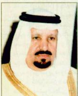
○ الأمير عبدالرحمن بن عبدالعزيز

○ الجبيل - عيسى الخاطر: يرعى صاحب السمو الملكي الأمير عبدالرحمن بن عبدالعزيز نائب وزير الدفاع والطيران والمفتش العام مساء الأربعاء القادم 27/2/421هـ حفل تخريج الدفعة 13 من كلية الملك فهد البحرية بالجبيل.