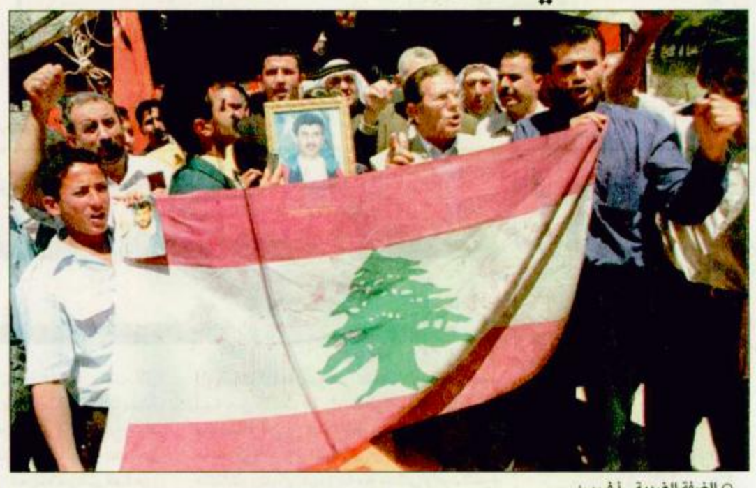
○ الضفة الغربية - أ.ف.ب: فلسطينيون يحملون العلم اللبناني خلال مسيرة احتفالية بالضفة الغربية فرحا بانسحاب إسرائيل من الجنوب اللبناني.