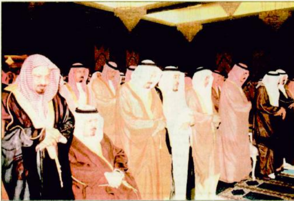
خادم الحرمين وعدد من الأمراء يؤمنون صلاة الميت على الأمير مشاري بن عبدالعزيز