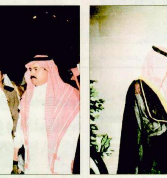
سمو ولي العهد لدى وصوله مكة المكرمة