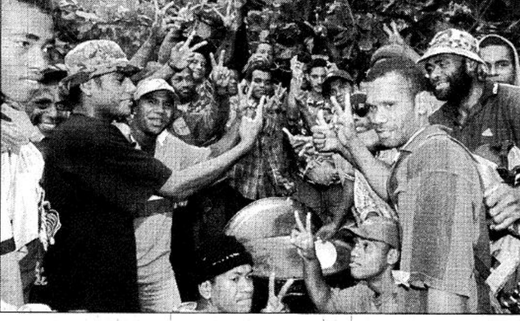
○ سوا - فيجي - الحبيب: مجموعة من الثوار يرفعون شارة للنصر امام مبنى البرلمان الذي يحتجزون فيه رئيس الوزراء المطروح وعددا من الرهائن.

○ سوا - الحبيب: صرح رئيس جزر فيجي راتو سير كاميس مارا للامم المتحدة ان رئيس الوزراء سيجبر على الاستقالة بعد ان يفرج عنه الانقلابيون ويستحل ادارة انتقالية محل حكومته.