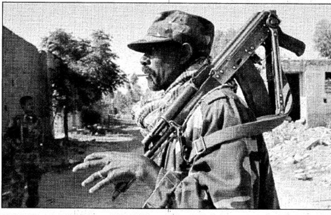
○ أسمره - إريتريا (رويترز): جندي إريتري يمشي في شوارع مدينة زالا انبيسا الواقعة على الحدود بين إريتريا وأثيوبيا حيث أعلنت القوات الإثيوبية انها استطاعت السيطرة على المدينة.