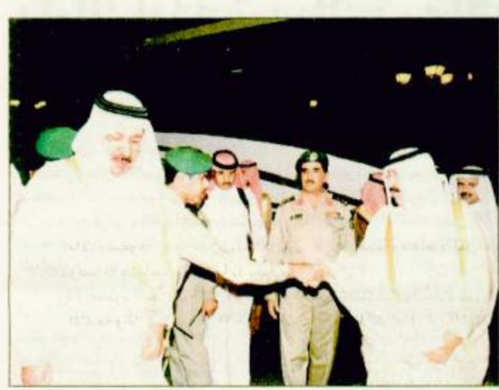
سموه لدى وصوله مكة المكرمة

تعزز مؤسسة الحرمين الخيرية ممثلة في لجنة المشاريع الموسمية تنفيذ العديد من البرامج الدعوية لصيف هذا العام ما بين دورات شرعية وجولات دعوية وذلك في كل من اليمن ولبنان والأردن وبنغلاديش والهند والصين وكوريا وقايبوان واستراليا والصومال وكينيا وتنزانيا ونيجيريا وجزر القمر وغينيا وكوتاكوري والبنانيا واليوسنة وكوسوفا والسويد والدنمارك وفنلندا والولايات المتحدة وكندا وفنزويلا والاكوادور والبرازيل وفرنسا.