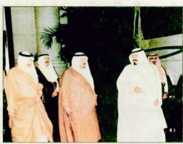
سمو ولي العهد لدى مغادرته جدة