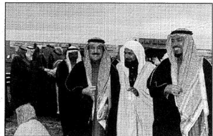
ووصف سموه المدينة الأكاديمية لكليات البنات بأنها معلم كبير من معالم العاصمة.