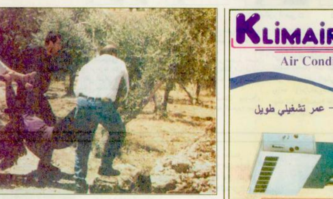
نابلس - الضفة الغربية المحتلة: فلسطينيون يحملون فتاة اصيبت برصاصة ونقلوها إلى عربة الاسعاف.. وفي الصورة الثانية جنود الاحتلال يطلقون رصاصاً حياً ومطاطياً على المظاهرات الفلسطينية في نابلس خلال المصادمات التي وقعت بين الجيش الاسرائيلي والمظاهرات اول امس.