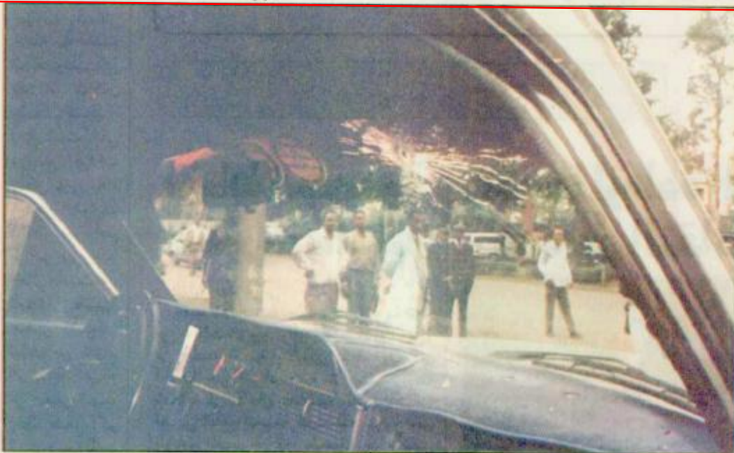
اديس أبابا - اثيوبيا: الحاخاب الزجاجي الامامي للسيارة التي استخدمها المسلحون الذين حاولوا اغتيال الرئيس المصري حسني مبارك أثناء سيره في مطار اديس أبابا في طريقه لحضور افتتاح قمة منظمة الوحدة الافريقية.

القاهرة - صوت ابو طالب - الرياض - واس: اجرى خادم الحرمين الشريفين الملك فهد بن عبد العزيز آل سعود اتصالاً هاتفياً ظهر أمس بأخيه فخامة الرئيس محمد حسني مبارك رئيس جمهورية مصر العربية. وقد اطمأن الملك المفدى على صحة أخيه الرئيس مبارك وهناءً بسلامة العودة الى أرض الوطن اثر نجاة الوفاة المرافق لفخامته بحمد الله من حادث الاعتداء الاليم الفاضل الذي تعرض له فخامته صباح أمس في العاصمة الاثيوبية اديس ابابا سائلا المولى جل شأنه ان يحفظ فخامته لشعب مصر الشقيق من كل سوء. وبدوره أعرب فخامة الرئيس لأخيه خادم الحرمين الشريفين عن عميق شكره وتقديره للشعائر الأخوية الصادقة متمنياً للملك المفدى دوام الصحة والعافية ولشعب المملكة العربية السعودية دوام التقدم والازدهار. كما بعث خادم الحرمين الشريفين الملك فهد بن عبدالعزيز آل سعود برقية الى فخامة الرئيس محمد حسني مبارك هذا نصها: صاحب فخامة الاخ الرئيس محمد حسني مبارك رئيس جمهورية مصر العربية ... القاهرة. السلام عليكم ورحمة الله وبركاته وبعد: فلقد ازعجتني حادث اطلاق النار الاليم الذي تعرض له