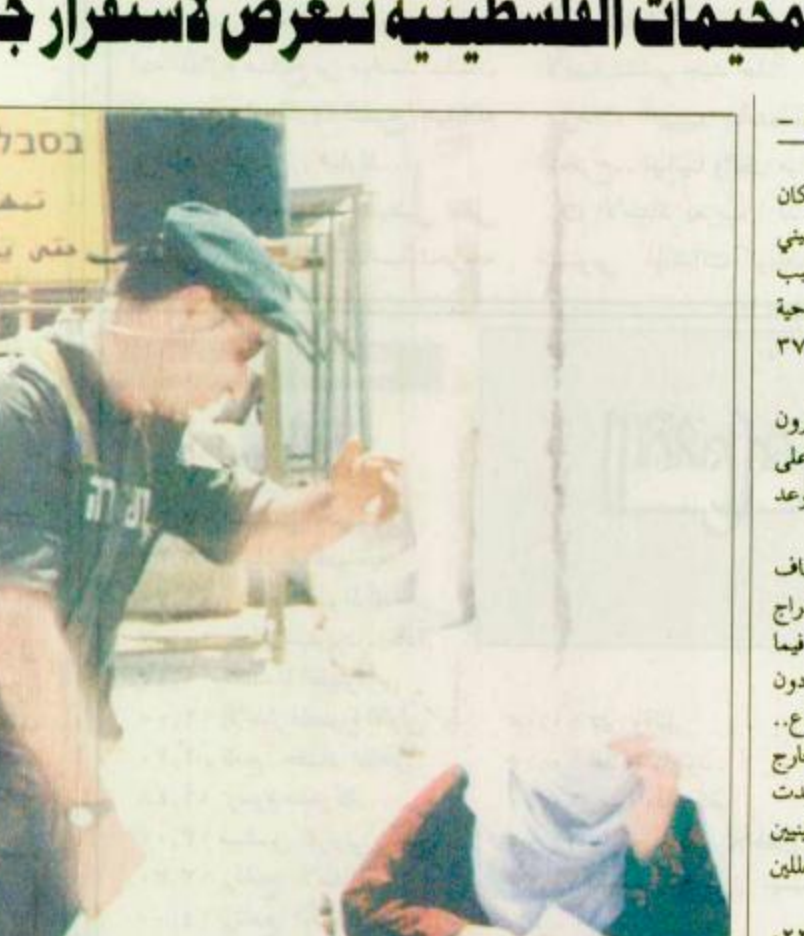
بسبب هذا التعليق والفتنجر حل الحامس والعشرون وكان شيئاً لم يكن.. فزل ذلك برداً وسلاماً على الجهتين الفلسطينية والاسرائيلية وتم ترحيل التوقيع لموعده جديد لم يعلن عنه بعد.

وعلى صعيد اخر ذهب تعهد رابين باستئناف المفاوضات بعد دفن ضحايا الانفجار ظهره الا ان اذراج الرياح ولم تستأنف المفاوضات حتى الثلاثاء (امس) فيما اشير لاستئناف المفاوضات اليوم الأربعاء في أوروبا دون تحديد للبلد ويحضر هذا ثالث تحريك لكان الاجماع.. فيما ظل استهداف موعده جديد لتوقيع الاتفاق خارج نطاق التصريحات الرسمية لسوولي الطرفين وان بدت خلال الومين الماضيين تصريحات المسؤولين الفلسطينيين اكثر تناولا لموضوع تأجيل موعده توقيع الاتفاق معللين البقية (ص ٢٢)