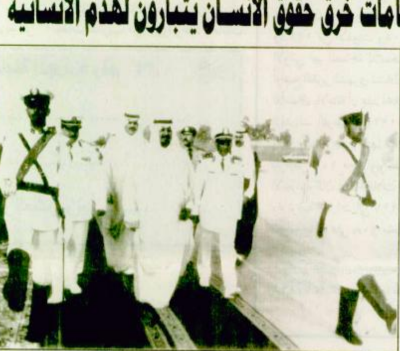
البحرية بالجبل: يتزامن مع الذكرى العاشرة لتأسيس الكلية كمرحى ساهم في احداث نقلة قوية وسريعة على طريق تسمية القوة البحرية المبرية. طالع (ص ٢٦)