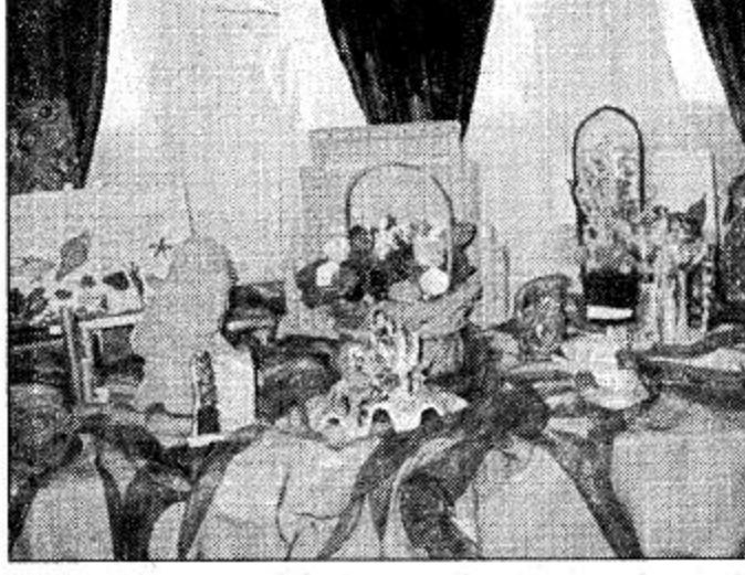
جانب من المعرض

أول مرة على مستوى منطقة الرياض مسابقة أفضل إنتاج مدرسي نظمها مشرفات قسم التربية الفنية بمكتب الإشراف التربوي بغرب الرياض