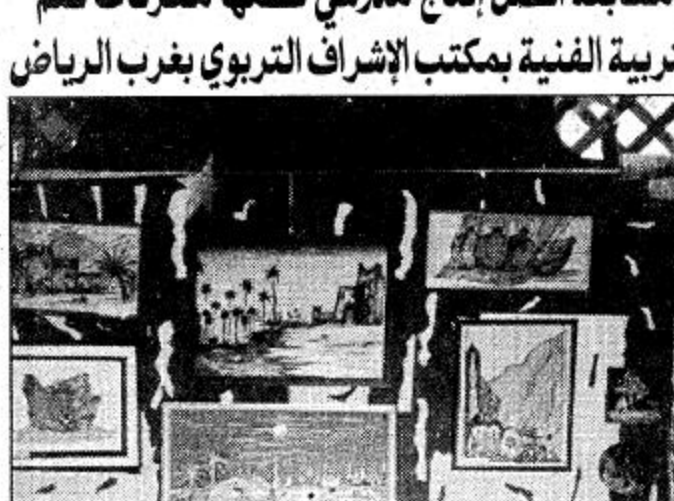
جانب من المعرض

تزداد خبرتي مع كل لوحة ارسمها فهناك احساس مختلف بكل لوحة.. وضريريات الرشيبة في كل لوحة.. فقد بدأت مثلاً باستخدام الألوان الزيتية والحرق على الخشب.. واللوان الاكريليك.. ولكني وجدت ضالتي في الرسم على الحرير. هل اللوحة يكون لها ترتيب مسبق سواء من جانب الفكرة أو (الموضوع) أو الاحاسيس والمشارع تنساب من خلال الريشة لتخرج اللوحة... قد تنتج اللوحة من خلال احساس.. اولحظة معينة.. فقد تكون احياناً ترحمة لمشاعر الغضب.. والفرح.. وقد تكون هناك فكرة مسبقه.. يظهر ذلك من خلال بعض لوحاتي في المعرض.. وهي فكرة تاريخ السودان مع الاستعمار فحاولتي ابراز ذلك من خلال معرفتي المتواضعة.. ومعالجة الموضوع ربما يراها البعض جيداً.. او غريبة خاصة من خلال الرسم على الحرير.. ما انطباعك عن المعرض... هي تجربة مفيدة للغاية بالنسبة لنا.. ولي بشكل خاص.. والتمنى ان تكون هذه البداية مقدمة لعروض أخرى قائمة بإنسان الله.. وبالتأكيد الزاى الأخير سوف يكون لضيوف وزوار المعرض الكرام..