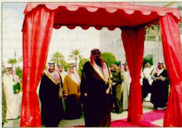
سمو ولي العهد لدى رعايته منتدى الاستثمار

نيابة عن خادم الحرمين الشريفين الملك فهد بن عبدالعزيز - حفظه الله - يرعى صاحب السمو الملكي الأمير عبدالله بن عبدالعزيز ولي العهد ونائب رئيس مجلس الوزراء ورئيس الحرس الوطني بمشيئة الله تعالى حفل افتتاح دورة كأس الخليج العربي الخامسة عشرة لكرة القدم الذي يقام مساء اليوم الأربعاء على استاد الملك فهد الدولي بالرياض. من جهة أخرى أكد صاحب السمو الملكي الأمير عبدالله بن عبدالعزيز ولي العهد ونائب رئيس مجلس الوزراء ورئيس الحرس الوطني أن المملكة العربية السعودية اتخذت قراراً استراتيجياً بالسعي لجلب الاستثمارات الوطنية والأجنبية وتوفير كل الحوافز والضمانات والتسهيلات اللازمة لجذب الاستثمارات وتشجيعها في جميع المجالات ومن ضمنها المجال الزراعي الذي يشوف على فرص غير محدودة للنجاح. والمسؤولون في وزارة الزراعة والهيئة العامة للاستثمار والجهات الأخرى المعنية على أتم الاستعداد لتقديم المعلومات اللازمة