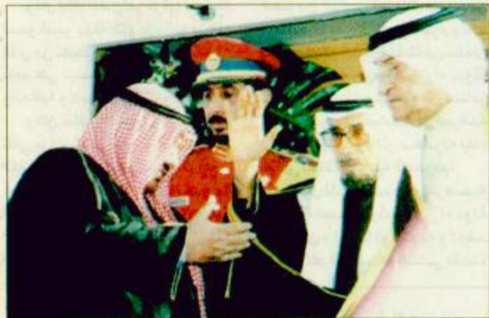
الكويت - أ. ف. ب.

خضع خلالها لعلاج بعد إصابته بنزيف محدود في الدماغ تلاه فترة نقاهة. وأطلقت نساء بين المستقبليين الزغاريد لدى ظهور الشيخ جابر عند باب الطائرة. البقية ص 35