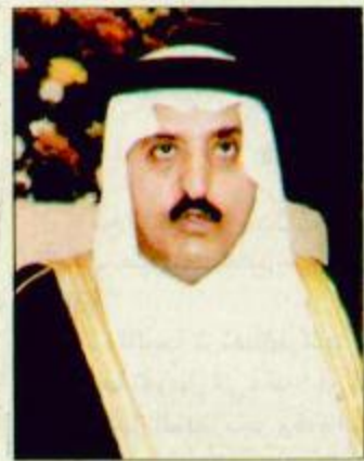
الأمير أحمد بن عبدالعزيز

استبعد صاحب السمو الملكي الأمير أحمد بن عبدالعزيز نائب وزير الداخلية تحقيق ما تسعى إليه بعض الجهات الخارجية المغرضة والمتعمد بإحداث انشقاق في المجتمع السعودي ما بين مؤيدين ومعارضين للحكم. ونفى سموه في حديث خص به الجزيرة أن تكون المملكة قد تسلمت أياً من السعوديين المشاركين ضمن التنظيمات الأفغانية كالعقيدة وغيرها، أو ما إذا تم تبليغ السلطات السعودية بوجود سعوديين بين الأسرى الذين تم ترحيلهم لإحدى القواعد الأمريكية في كوبا. وعلى صعيد آخر فقد سمو نائب وزير الداخلية ما يشاع عن اتباع قيادة المملكة سياسة القمع لشعبها.. وقال: إن واقع المجتمع ينبغي ذلك. طالع الحديث ص (39)