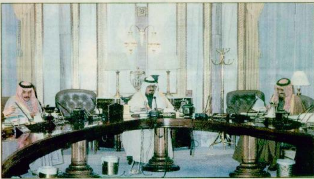
الرياض: محمد السنيدي ترأس صاحب السمو الملكي الأمير سلطان بن عبدالعزيز النائب الثاني لرئيس مجلس الوزراء وزير الدفاع والطيران والمفتش العام ورئيس مجلس إدارة الهيئة الوطنية لحماية الحياة الفطرية وانمائها في الساعة البقية ص 28.

الأمير سلطان ترأس اجتماعاً لمجلس إدارة الهيئة الوطنية لحماية الحياة الفطرية سعود الفيصل: تنسيق الجهود للمحافظة على منطقة الصمان ومكوناتها الطبيعية