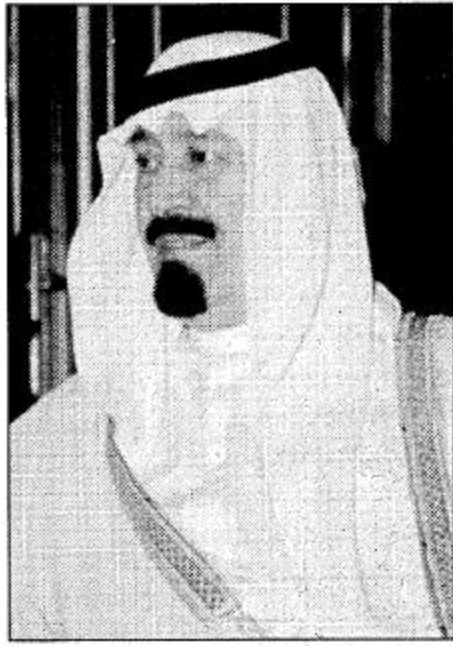
الجنوبية هدية تذكارية لسمو ولي العهد بهذه المناسبة.

المدرسة العقيد طيار احمد الخميس عن انشاء المدرسة ومهامها ثم سلم سمو ولي العهد راية المدرسة لقائد المدرسة قائلاً: «أسلمك هذه الراية وأرجو أن تحافظ عليها امانة في عنقك وان تجعل مخافة الله عزوجل أمام عينك وان تحافظ عليها بحماية لديتك ثم عليك من طمأنينة فاجاب قائد المدرسة «سأفعل بحول الله»، ثم عزف السلام الملكي وغادر سموه الموقع بمثل ما استقبل به من حفاوة وتكريم.