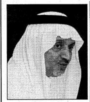
محافظة خميس مشيط