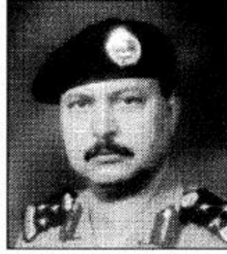
عميد / عبدالعزیز بن حمد السرهان

مدير شرطة منطقة الحدود الشمالية والنورس.. والله ولي التوفيق..