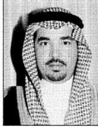
○ مدير الشؤون الصحية

في هذا الصدد أن حكومة خادم الحرمين الشريفين وسمو ولي عهده الأمين وسمو النائب الثاني قد أولت القطاع الصحي جل اهتمامها ورعايتها جامعة صحة المواطن في مقدمة الأولويات مشيراً سموه إلى أن المملكة العربية السعودية في عهد خادم الحرمين الشريفين