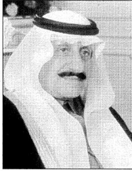
○ أمير الحدود الشمالية

وسمو ولي عهده الأمين وسمو النائب الثاني أيدهم الله تعف اليوم في مصاف الدول المتقدمة في هذا المجال وفقرت أفضل الخدمات الصحية للمواطن أينما وجد على تراب هذه الأرض الطيبة المباركة من خلال افتتاح وإنشاء المستشفيات والمراكز الصحية داعياً الله أن يحفظ لهذه البلاد خادم الحرمين الشريفين وسمو ولي عهده الأمين وسمو النائب الثاني وأن يديم على بلادنا نعمة الأمن والأمان والاستقرار وأن يحفظ هذه البلاد وأهلها من كل مكروه.