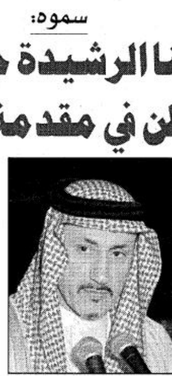
○ وزير الصحة

في هذا الصدد أن حكومة خادم الحرمين الشريفين وسمو ولي عهده الأمين وسمو النائب الثاني قد أولت القطاع الصحي جل اهتمامها ورعايتها جامعة صحة المواطن في مقدمة الأولويات مشيراً سموه إلى أن المملكة العربية السعودية في عهد خادم الحرمين الشريفين