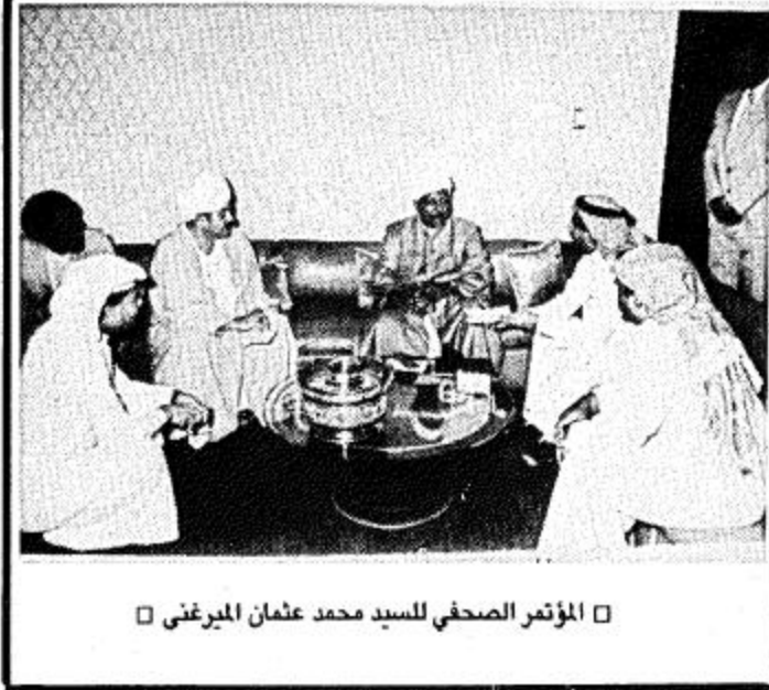
المؤتمر الصحفي للسيد محمد عثمان الميرغني

هكذا تمودنا .. نعم تمودنا على ان تحدث الانجازات والشايع بنضها دون ان نتحدث عنها نحن .. والازلت اذكر ذلك الوقت الصحفي الكويتي الشقيق الماضي .. ودخل ذوقاً تاماً حينما زار بعض المراق والمعلم في مدينة الرياض .. كمستشفى القوات المسلحة والتخصي وطوار الملك خالد الدولي وجماعة الملك سعود .. دخلوا لما شاهدوا عشرات الجسور والاتفاق .. دخلوا لما شاهدوا هذه المدينة الضخمة الكبيرة .. تحوي بين جنباتها مايقارب الليوني نسة أو يزيد .. وهي توفر لهم كل شيء توفير لهم عليه بأي شيء في عصر يضم مئات الملايين من الجموع والمواطنين .. ودخل غيرهم .. بهذا الأمن الفريد الذي تتمتع به تلك القارة الضخمة .. شبه الجزيرة العربية