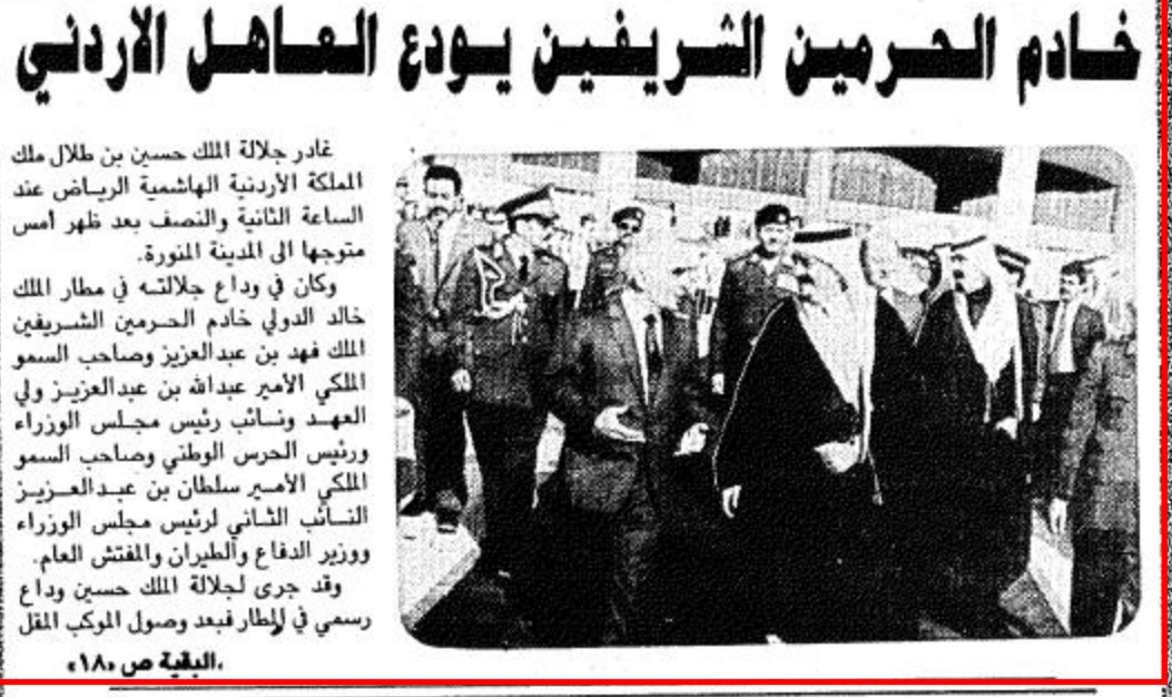
غادر جلالة الملك حسين بن طلال ملك المملكة الأردنية الهاشمية الرياض عند الساعة الثانية والنصف بعد ظهر أمس متوجهاً إلى المدينة المنورة. وكان في وداع جلالاته في مطار الملك خالد الدولي خادم الحرمين الشريفين الملك فهد بن عبدالعزيز وصاحب السمو الملكي الأمير عبدالله بن عبدالعزيز ولي العهد ونائب رئيس مجلس الوزراء ورئيس الحرس الوطني وصاحب السمو الملكي الأمير سلطان بن عبدالعزيز النائب الثاني لرئيس مجلس الوزراء ووزير الدفاع والطيران والمفتش العام. وقد جرى لجلالة الملك حسين وداع رسمي في المطار بعد وصول المركب المقل.

تسلم سمو أمير دولة الكويت الشيخ جابر الأحمد الصباح رسالة من خادم الحرمين الشريفين الملك فهد بن عبدالعزيز آل سعود. وكان معالي الدكتور محمد قد وصل إلى الكويت في وقت سابق أمس. كما بحث خادم الحرمين الشريفين رسالة إلى أخيه صاحب السمو الشيخ عيسى بن سلمان آل خليفة أمير دولة