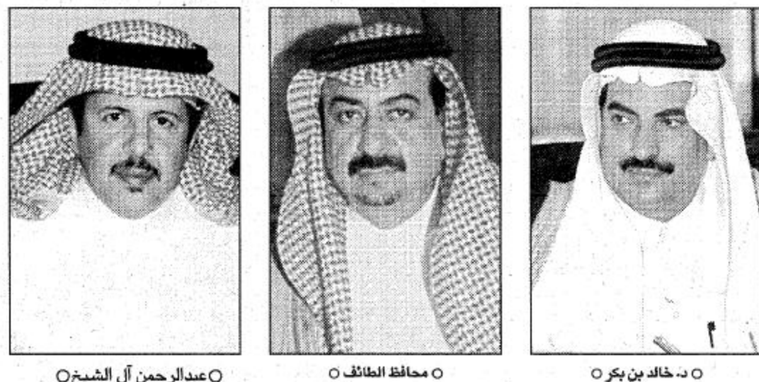
رحلات حج عبر الطائف

○ أوصى مجلس منطقة مكة المكرمة أخيراً برئاسة صاحب السمو الملكي الأمير عبدالجيد بن عبدالعزيز بتوسعة وتطوير مطار الطائف لاستيعاب عدد من الحجاج والمعتمرين بهدف التخفيف على مطار الملك عبدالعزيز فيما الذي تم التوصل إليه في هذا الموضوع ؟ لا شك أن الدولة أعزها الله ممثلة في مولاى خادم الحرمين الشريفين وسمو ولي عهده الأمين وسمو النائب الثاني يولون الحجاج والمعتمرين أهمية قصوى وأكبر مثال على ذلك ما تقدمه حكومة مولاى خادم الحرمين الشريفين من خدمات جليلة واستعدادات كبيرة لخدمة ضيوف الرحمن من حجاج ومعتمرين، ومن هذا المنطلق تم نرساة استقبال مطار الطائف لرحلات الحج والعمرة الدولية من دول الخليج من قبل الخطوط السعودية وعمل التصور الكامل وتم رفع ذلك من قبل معالي محافظ الطائف لصاحب السمو الملكي الأمير عبد الجيد بن عبدالعزيز أمير منطقة مكة المكرمة ودعم بتقرير متجامل من معالي مدير عام السعودية، خالد عبدالله بن بكر إلى أمير منطقة مكة المكرمة حسب طلبه، لذا فقد ارتكزت دراسات الخطوط السعودية للمطالبة بنزول رحلات الحج والعمرة لدول مجلس التعاون الخليجي حسب إمكانات مطار الطائف المتاحة، وأمر منطقة مكة المكرمة بولي هذا الموضوع اهتمامه الخاص.