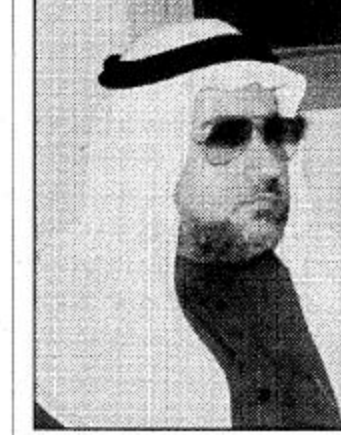
د. عبداللطيف الحليبي

ملا عام من التوحيد والبناء كان وما زال سمو الأمير عبدالله بن عبدالعزيز أحد ركائزها الملخمين الأوفياء لديته وأمتة ووطنه. إن كل مواطن يشعر بالفخر والاعتزاز لزيارة سموه الكريم وهو يترك مشاغله ويتفرغ للقاء يشاركهم الاحتفاء والأفراح فمرحياً بسمو ولي العهد بين إخوانه وأبنائه للوطنين أهالي الأحساء. إنه الله أن يحفظ لهذه البلاد أمنها واستقرارها في ظل حكومة خادم الحرمين الشريفين - يحفظه الله - وسمو ولي عهده الأمين وسمو النائب الثاني وأن يسبحم نعمة الأمن والاستقرار. وأن يجعل ما يقدمونه للإسلام والمسلمين في موازين حسناتهم.