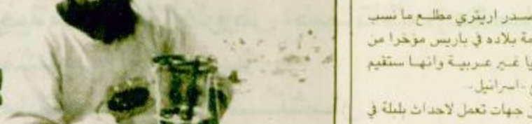
مرج الزهور - لبنان - (أ ب) احد المعدين الفلسطينيين يقوم بتثبيت مضياح يجعل بالكر ووسن مساء الثلاثاء الماضي استعداداً لليلة اخرى في مرج الزهور. البوليس اللبناني يقول ان ثمانية طلقات هاون سقطت على بعد نصف ميل من معسكر المعدين. انطلقت مما يسمى بالشرطة الامني الاسرائيلي بالجنوب اللبناني.

عرضت اسر الأول السلطات في مدينة نيويورك وهيئة ميناء نيويورك ونيوجيرسي مكافأة قدرها سائتي الف دولار لمن يرشد بمعلومات تؤدي الى القبض على مرتكبي حادث تفجير مركز التجارة الدولي. وتأتي هذه المكافأة بعد ان طلب عدة مدينة نيويورك ديفيد دينكتر من مجلس المدينة رفع الحد الاقصى للمبلغ الذي رصدته المدينة للمكافأة وهو عشرة الاف دولار بمقدار عشرة اشعاعاف للمساعدة في القبض على الجناة. ورصدت هيئة ميناء نيويورك التي تملك وتدير المبنى المالي المكون من ١١٠ طوابق ويضم برجين ميلغا مائلاً للمبلغ الذي رصدته سلطة المدينة. وكان انفجار ضخم قد هزم مركز التجارة الدولي يوم الجمعة الماضي حيث حدث الانفجار في الجراج الكائن اسفل المبنى مما اسفر عن مصرع خمسة اشخاص واصابة اكثر من الف شخص اخرين. وتعتقد السلطات طبقاً لـ د. ب. أ.