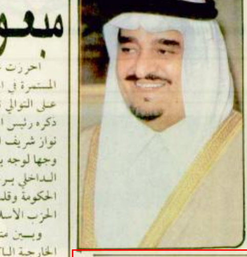
سعود ولي العهد يستقبل جمعا من المواطنين

شوه مركز الخليج للدراسات الاستراتيجية في لندن ومنظمة /متمتدى الدفاع والامن/ البريطانية بالدور الذي قامت به المملكة العربية السعودية بقيادة خادم الحرمين الشريفين الملك فهد بن عبدالعزيز آل سعود من اجل تيسير الكويت من الاحتلال العراقي. وصفا هذا الدور وفق ما بثته وكالة الأنباء الكويتية طبقاً لروايات بأنه كان الدور الاساسي في تحرير الكويت. جاء ذلك في رسالة رفعها رئيس مركز الخليج للدراسات الاستراتيجية بلندن الدكتور عمر الحسن ورئيسة منظمة /متمتدى الدفاع والامن/ البريطانية السيدى اولغا ميتلاند لمن لخادم