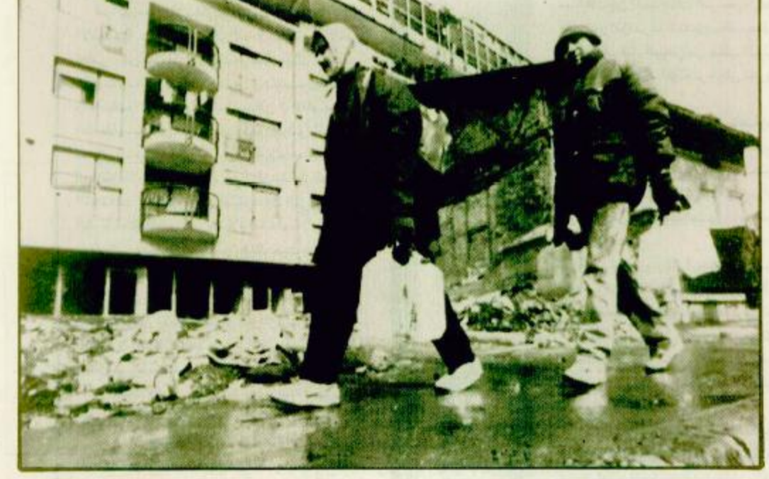
سرايفو - البوسنة والهرسك - (أ ب) سكان سرايفو يحملون زجاجات الماء في طريقهم | ملحقا بالقيادة قبل ذهابهم لاداء اعمالهم اليومية رغم مقتل العديدين في عمليات القصف المتقطعة

يؤيده المبعوث الخاص لخادم الحرمين الشريفين أحرزت محادثات السلام الأفغانية المستمرة في اسلام اباد لليوم الثالث على التوالي تقدماً ملحوظاً طبقاً لما ذكره رئيس الوزراء الباكستاني محمد نواز شريف الذي قام بترتيب اجتماع وجهها لوجه بين قاضي النزاع الافغان الداخلي يرهان الدين رباني ورئيس الحكومة وقلب الدين حكمتيار زعيم الحزب الاسلامي ويمن متحدث باسم وزارة الخارجية الباكستانية - طبقاً لروايات - ان الزعيمين الأفغان اجتمعوا بمقر الحكومة الباكستانية لمدة ساعتين تقريباً. وايضا محمد نواز شريف والصحفيين ان رباني وحكمتيار سوف يعقدان اجتمعا اخر غداً. وتم ترتيب تجمع الزعماء الأفغان في اسلام اباد في عقاب نداء السلام التاريخي الذي وجهه في يناير الماضي لخادم الحرمين الشريفين الملك فهد بن عبدالعزيز آل سعود ووجد قولاً واسع النطاق لذي عني السلام والاستقرار في افغانستان. ويعمل صاحب السمو الملكي الامير تركي الفيصل بشاغل نائب من اجل قضية السلام في افغانستان وحث الاحزاب الافغانية على حل مشكلتهم من خلال التفاوض السلمي. من جهته اعرب المتحدث باسم الخارجية الباكستانية الليلة الماضية عن تقدير باكستان للدور الذي