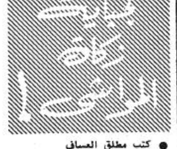
كتب مطلق المساف

الرياض - 1 اس : لاتزال الميزانية الجديدة تلقى استحسانا بين مختلف المواطنين والمسؤولين ، التي منسوبة وكالة الأنباء السعودية بعدد من المسؤولين في الدولة حيث علق هؤلاء على ما تحمله الميزانية من الخير لابناء المملكة .