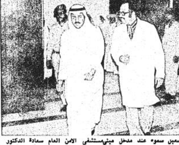
الملك فيصل بن عبد العزيز مع وزير الدولة للشؤون الداخلية الامير نايف بن عبد العزيز في مستشفى الامن العام بالرياض

كتب منصور الشام قام صاحب السمو الملكي الامير نايف بن عبد العزيز وزير الدولة للشئون الداخلية بزيارة لمستشفى الامن العام بالرياض وذلك لتفقد حالة المرضى اليمانيين الذين ارسلوا من بلادهم ( الجمهورية العربية اليمنية ) لتلقي العلاج الطبي في هذا المستشفى . وقد اجتمع سموه بؤؤلاء المرضى واطمان على صحتهم وطمأنهم على العناية والرعاية التي تبذلها هيئة المستشفى - ادارة واطبائه وممرضين - نحو المرضى المذكورين