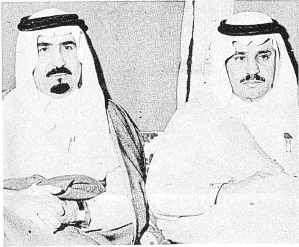
● سمو وزير الداخلية وسمو وزير الشؤون البلدية والقروية في حفل الأمير سلمان ●