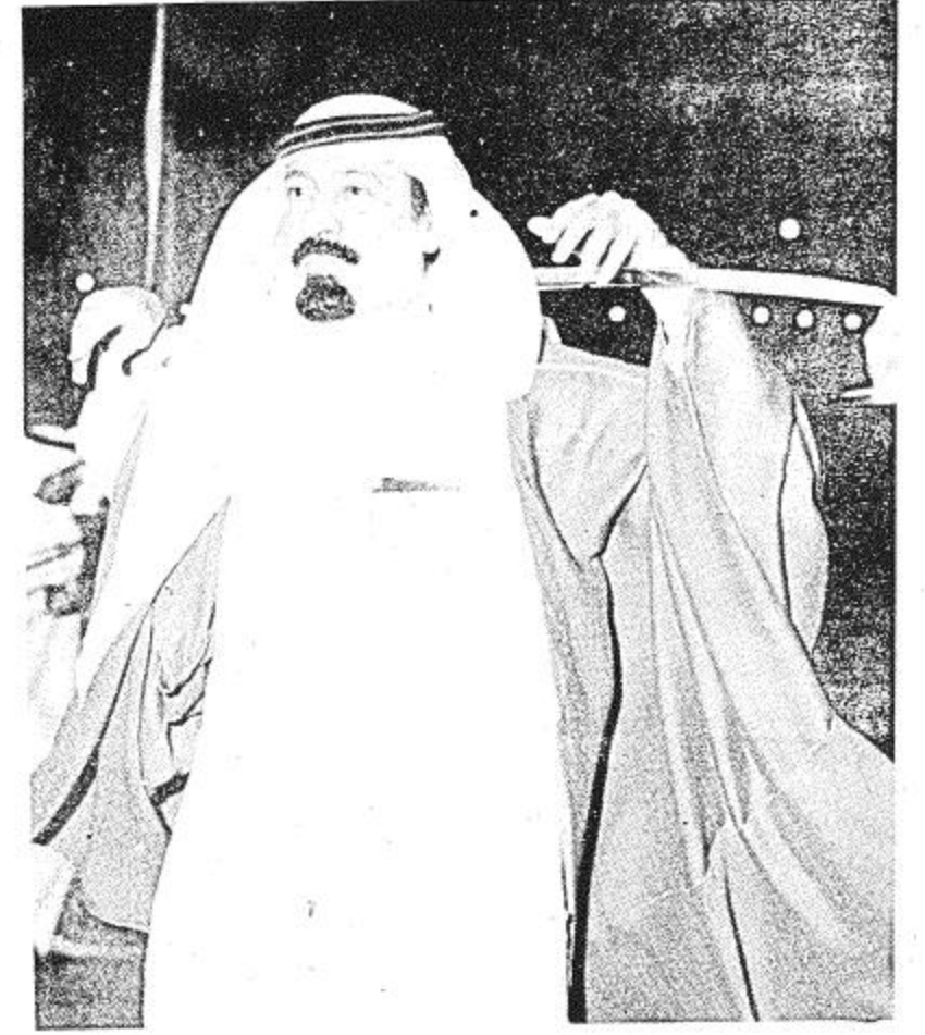
● الأمير عبد الله ابن هذه الصحراء وأحد رجالها ●