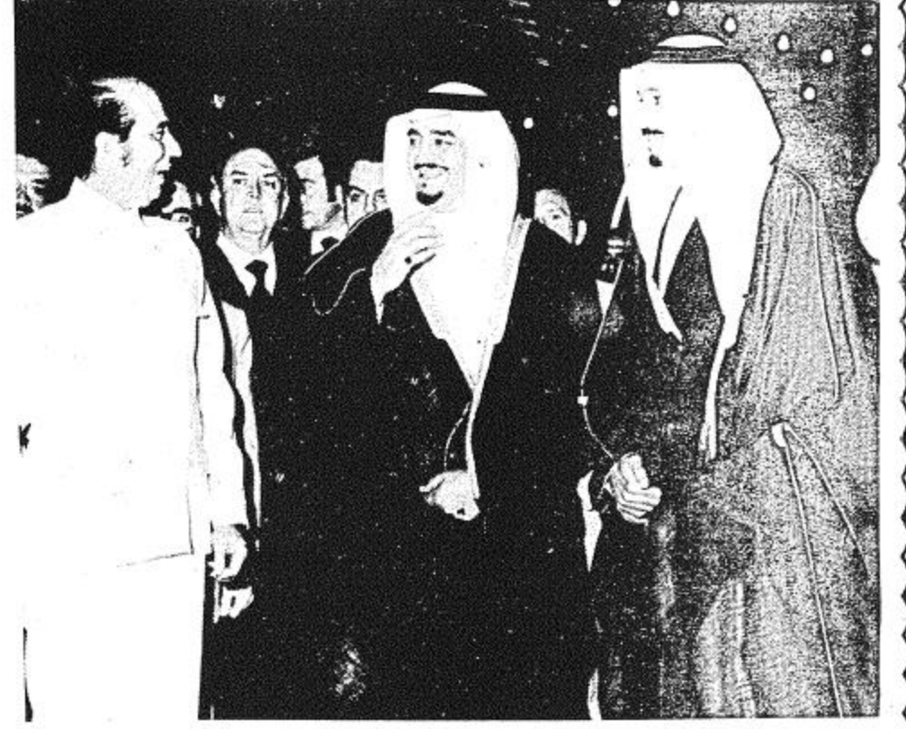
● الفهد بين ضيفه وأمير الرياض ●