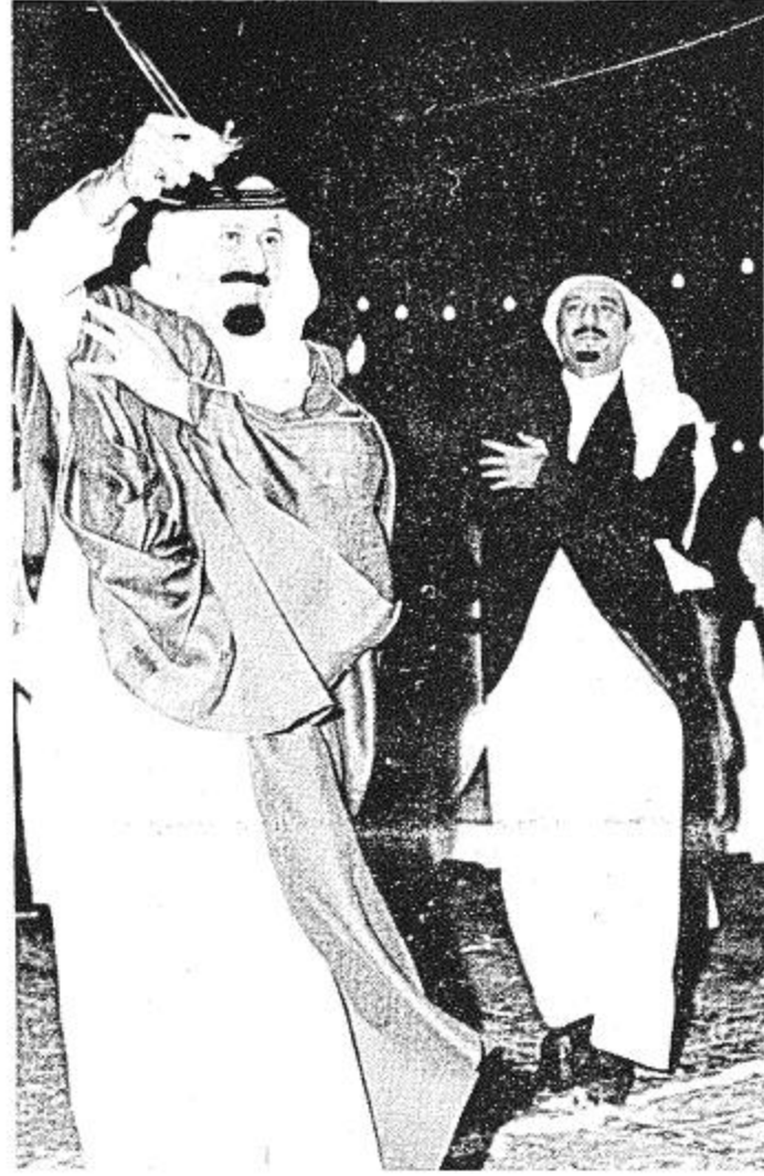
● عبد الله في رقصة الحرب ومن خلفه الأمير سلمان ●