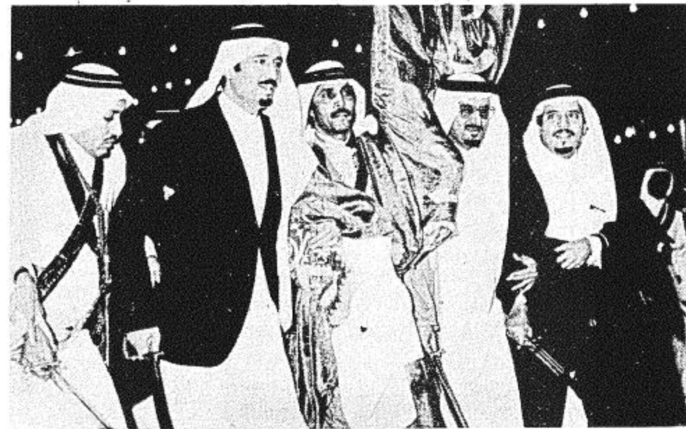
● الأمير سلمان مع بعض الإمراء في رقصة الحرب ●