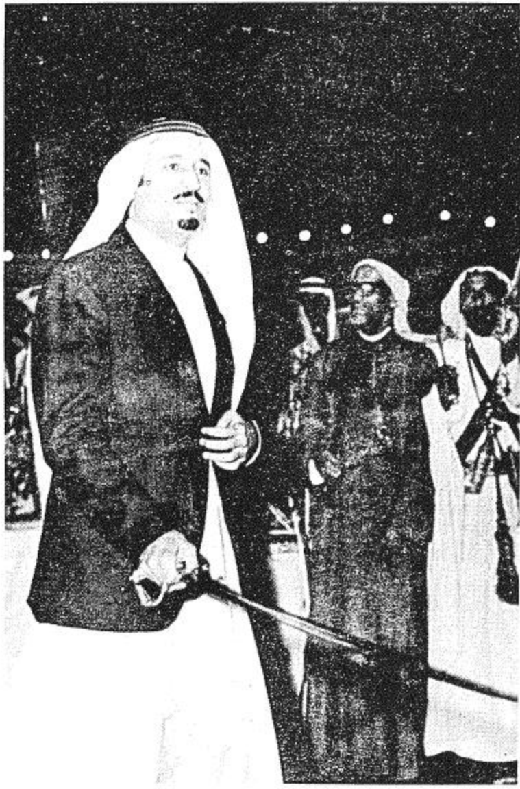
● سلمان رجولة وشهامة وأمير الرياض ●