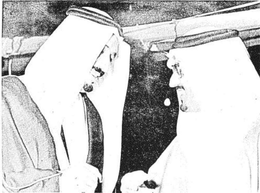
● أمير الرياض وأمير عسير وبسالة في الحياة ●