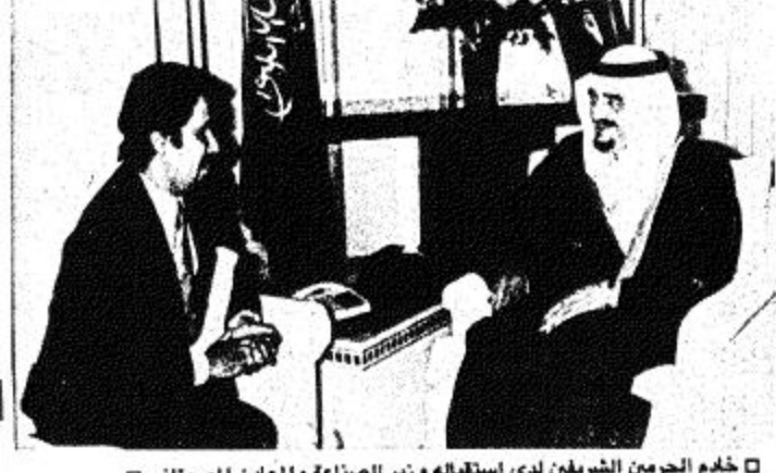
خادم الحرمين الشريفين لدى استقباله وزير الصناعة والمعادن الموريتاني