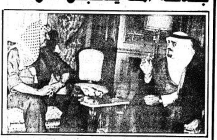
جلالة الملك يستقبل عرفات في الرياض