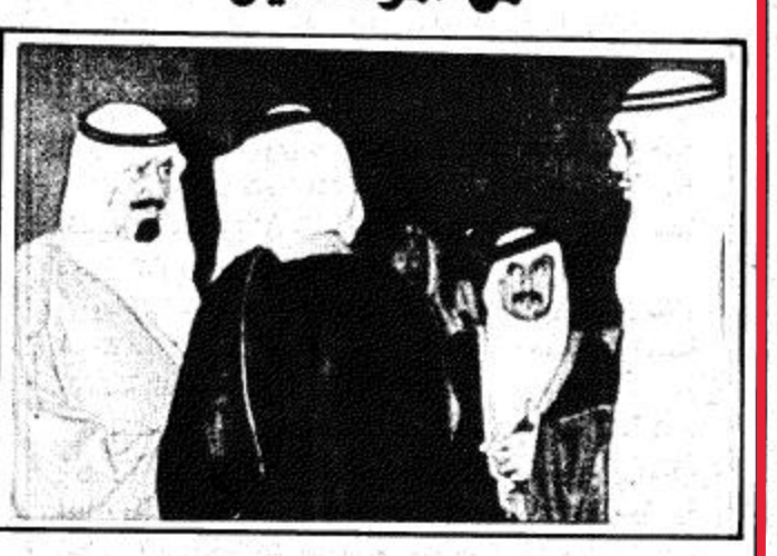
سمو ولي العهد يستقبل المواطنين في الرياض