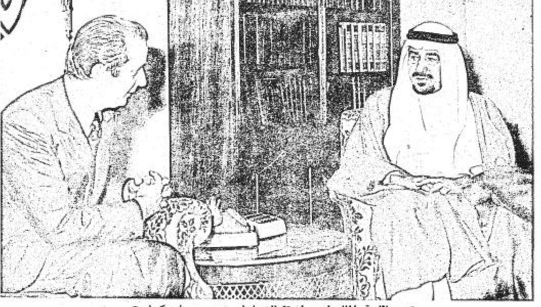
• جلالة الملك لدى استقباله لولي عهد بلجيكا

كانوا سواء منهم من كان في الجهاز المركزي او فروع او اللحقين خارج بلاد ( رجلا ) يرتفعون بالتقسيم الى مسقوى مسؤولياتهم ، ويبدلون كل جديناح اعمالهم ، ويحملون في سبيل ذلك الكثير والكثير لم لا يتكبر لهم صفو ، او يسوء لهم واقع ، او يكفهر منهم وجه ، تتضخم مسؤولياتهم كل عام ، ويقابلون ذلك - على قلة عددهم ، بصبر وعزيمة واصرار .. ولئن غنمت شيئا من خلال تلك السنوات بعد توفيق الله الذي ارجو ان يصاحبني دائما - لقد غنمتهم وهم الالاف ( اصداق ) زانهم الوفاء ، ( اخوة ) تقصر قلوبهم مودة الايمان الصادقة ، ومن الحلال ان اعبر عن مشاعري نحوهم في مثل هذه الكلمة لثقت كانوا ( رجلا ) بكل ما تحمله هذه الكلمة من معنى ، وهل في الاستطاع دائما ابقاء الرجال حقهم ؟ والله اعلم .. حسن عبد الله آل الشيخ