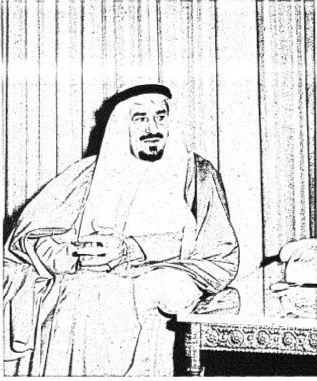
جلالة الملك خالد بن عبد العزيز