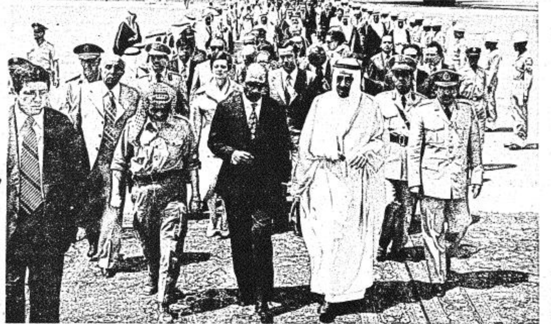
• لحظة من وصول الرئيس السادات الى مطار الرياض

• جولة الملك والرئيس السادات وابر عرفان يجتوا أسس الوضع في الشرق الأوسط