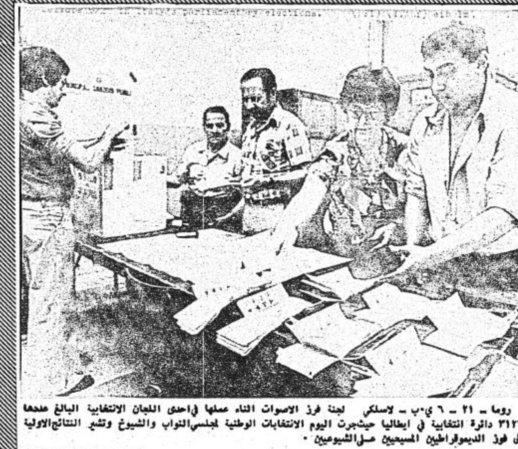
روما - ٢١ يونيو - اسلكي لجنة فرز الاصوات الثمانية التي فاز بها اليمين الانتخابية البالغ عددها ٢١٦٦ دائرة انتخابية في إيطاليا حشرت اليوم الانتخابات الوطنية لجلسي النواب والشيوخ وتنتج النتائج الاولية ان فوز الديموقراطيين المسيحيين على الشيوعيين .