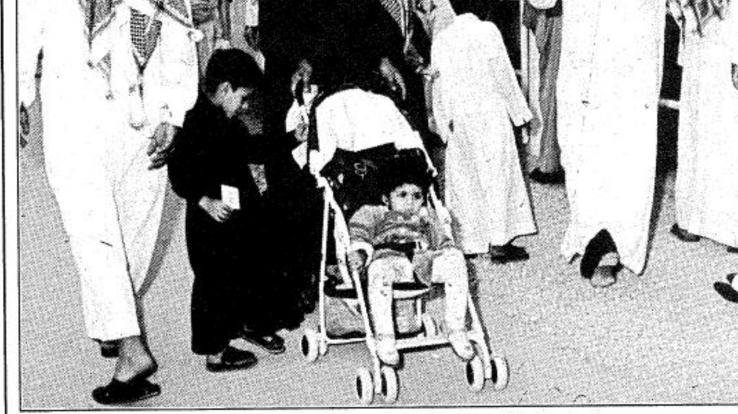
أصغر زائرة في جنادرية ١١