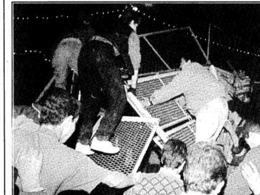
بيت لحم - الضفة الغربية - المحتلة - عمان - القاهرة - الجزيرة - الوكالات. افاد مراسل وكالة فرانس برس ان رئيس السلطة الفلسطينية عاد صباح أمس الاثنين على متن مروحية الى قطاع غزة الخاضع للحكم الذاتي الفلسطيني قادماً من بيت لحم. وقد قام عرفات بأول زيارة له الى بيت لحم التي انسحب منها الجيش الاسرائيلي بعد احتلال دام 28 سنة.

وكان قد ترأس بعد وصوله السبيل الى المدينة اجتماعاً للحكومة الفلسطينية. وصرح مصدر فلسطيني بان طلائع قوات الامن الوطني الفلسطيني دخلت الى منطقة رام الله الليلة قبل الماضية تمهيدا لانسحاب القوات الاسرائيلية منها غدا الاربعاء.