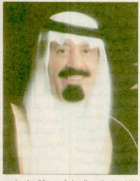
١٤١٦هـ في قصر اليمامة بمدينة الرياض أبدى تأكيده بأن العلوم والتقنية على المستوى العالمي تؤدي دوراً مهماً وأساسياً في التقدم الاجتماعي