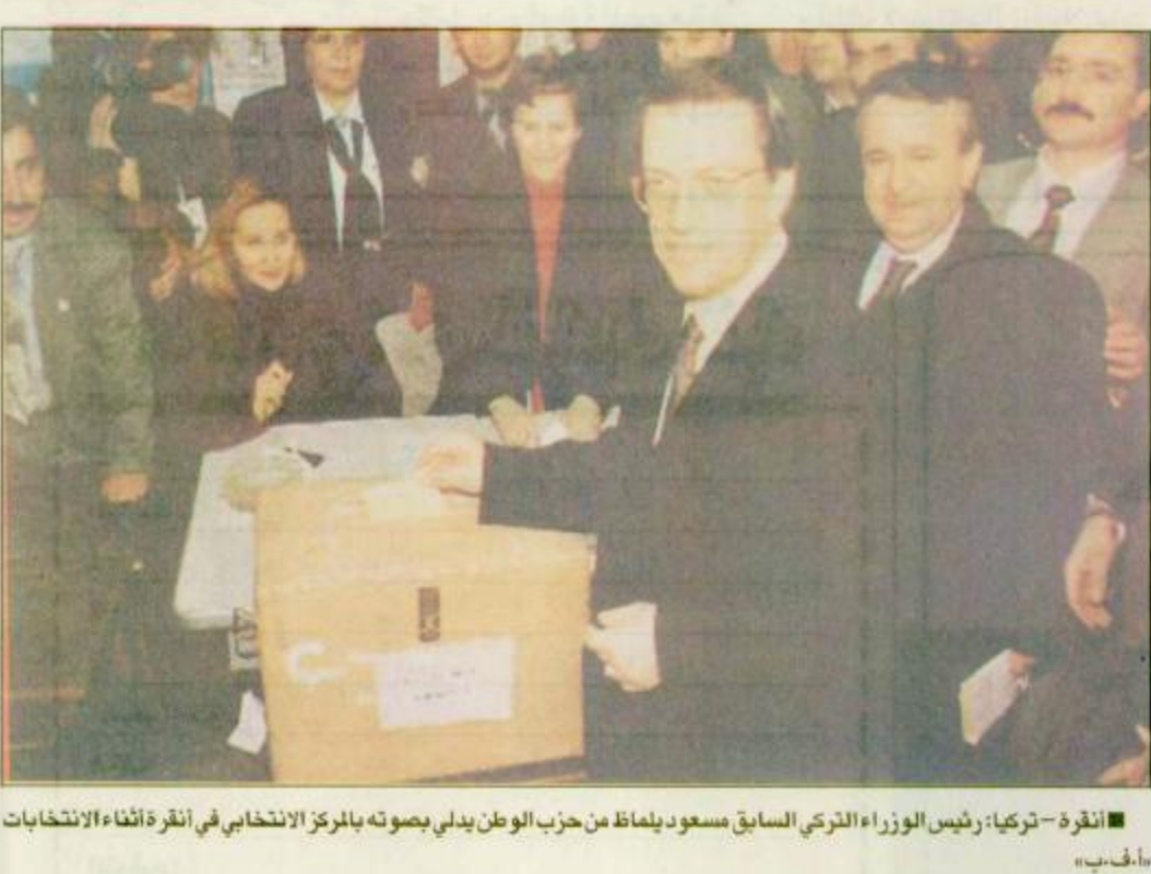
انقرة - تركيا: رئيس الوزراء التركي السابق مسعود ديملاط من حزب الوطن بدلي بصوته بالمرزق الانتخابي في انقرة أثناء الانتخابات

صدام حسين. وافادت المصادر الداخلية بأن صدام حسين أوعز إلى الفريق الركن عبد الواحد ششان الرباط رئيس هيئة الأركان العامة للقوات المسلحة بأجراء حركة تنقلات بين فترة وأخرى تشمل قيادة الفرق والوحدات العسكرية الفاعلة وأخصاع كبار القادة والأخريين إلى مراقبة شديدة من قبل جهاز الأمن العسكري، داخل وخارج وحداتهم وفرض رقابة على هواتهم الشخصية. في جهة أخرى شنت أجهزة الامن العسكري الاسبوع الماضي حملة اعتقال واسعة في صفوف كبار ضباط الجيش العراقي وبخاصة من أبناء الموصل وقضاء تلعفر التابع لحافطة نينوى وشملت الاعتقالات عددا من الضباط المتقاعدين اثر توزيع منشورات وملصقات جدارية تندد بالنظام الحاكم وتدعو المواطنين إلى التهيؤ استعداداً للثورة المسلحة وشيكة