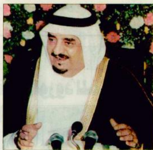
خادم الحرمين يتلقى اتصالاً هاتفياً من الشيخ زايد جدة - واس:

تلقى خادم الحرمين الشريفين الملك فهد بن عبدالعزيز آل سعود اتصالاً هاتفياً أمس من أخيه صاحب السمو الشيخ زايد بن سلطان آل نهيان رئيس دولة الامارات العربية المتحدة هنا خلاله خادم الحرمين الشريفين بعيد الاضحى المبارك وبجناح مواكب الحج لهذا