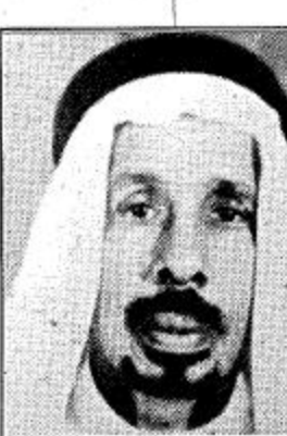
الشيخ محمد بن عبد الله العلي القدير

وليسعني في هذه المناسبة الكريمة وأنا أرى الفرحة تعم أرجاء القصيم فرحين مستبشرين بزيارة سمو ولي عهدنا الأمين لافتتاح جامع الملك فهد ببريدة ووضع حجر الأساس لامارة منطقة القصيم وكذلك افتتاح فرع جامعة الملك