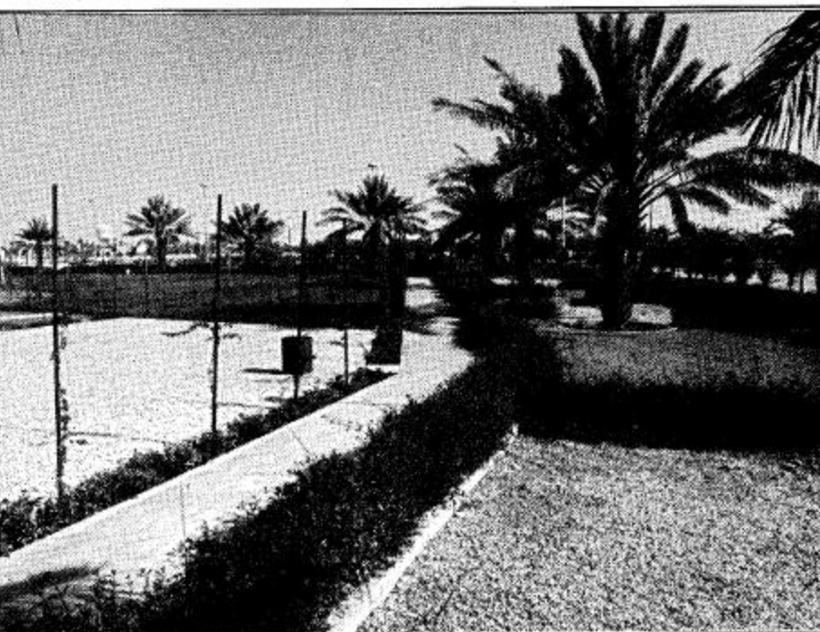
مصانع الصباخ للبلوك والخرسانة