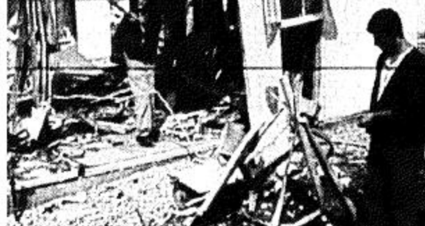
كارلوفاك كرواتيا - ا ب الثامن من اللاجئين من سلوفيا الواقعة على مسافة ١٠٠ كيلومتر جنوبو زغرب يتلقون التفتيات التي لحقت بمسكنهم في مخيم اللاجئين في كارلوفاك الذي تعرض للصف المدفعية الصربية