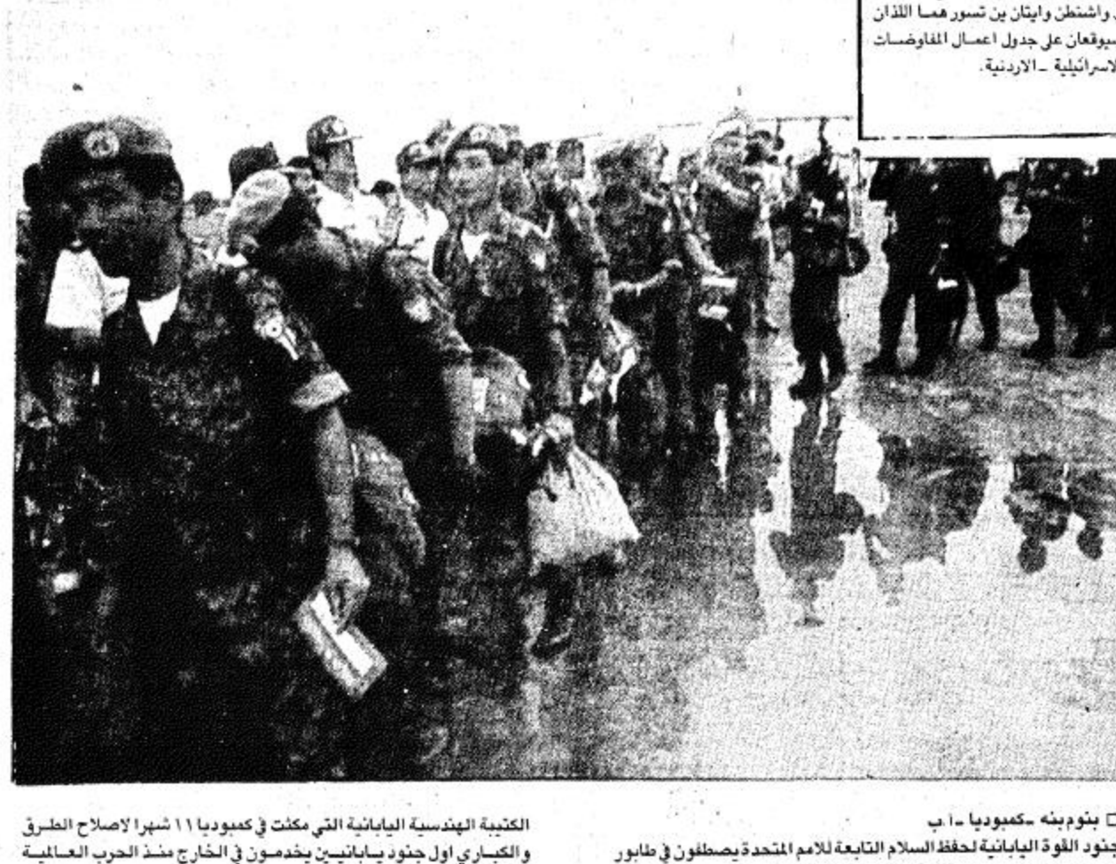
ب يونيوه حكوموديا - ا ب جنود القوة اليابانية لحفظ السلام التابعة للامم المتحدة يصلون في طابور قبل ان يستقروا على طابور في تايوان بعد ان اكتملوا مهمتهم. وتعتبر هذه الثانية