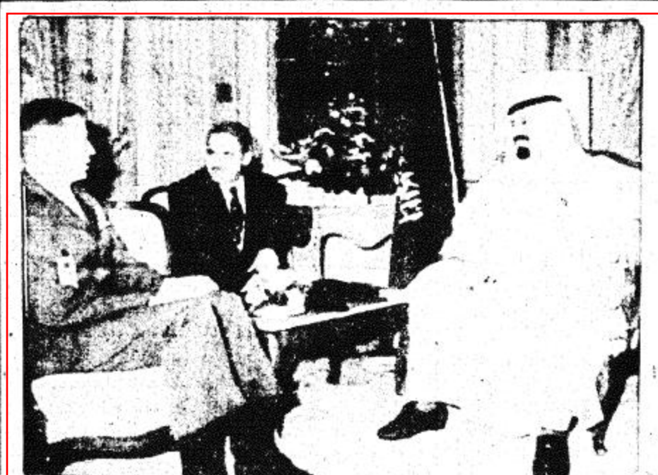
□ سمو ولي العهد يستقبل القائد العام للقيادة المركزية الأمريكية □

الحسن بن عبد العزيز التوجيهي كما استقبل سمو الامير عبد الله بن عبد العزيز في مكتب سموه امس الفرياق اول جوزيف في عهد القائد العام للقيادة المركزية الأمريكية والوفد المرافق له. وحضر المقابلة معالي المستشار بسديوان سمو ولي العهد الاستاذ عبد الحسن بن عبد العزيز التوجيهي والقائم باعمال السفارة الأمريكية لدى المملكة والعميد وليد نياغ مدير المشروع الاميركي بالحرس الوطني.