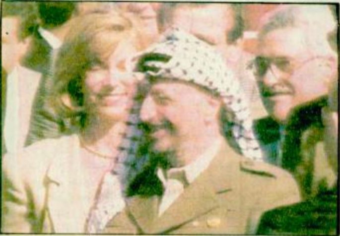
وصول عرفات الى واشنطن

على اسحق (رايين). لكي اعتقد انه وترافق ليا رايين زوجها الى سينجاز هذه الصنوعة.