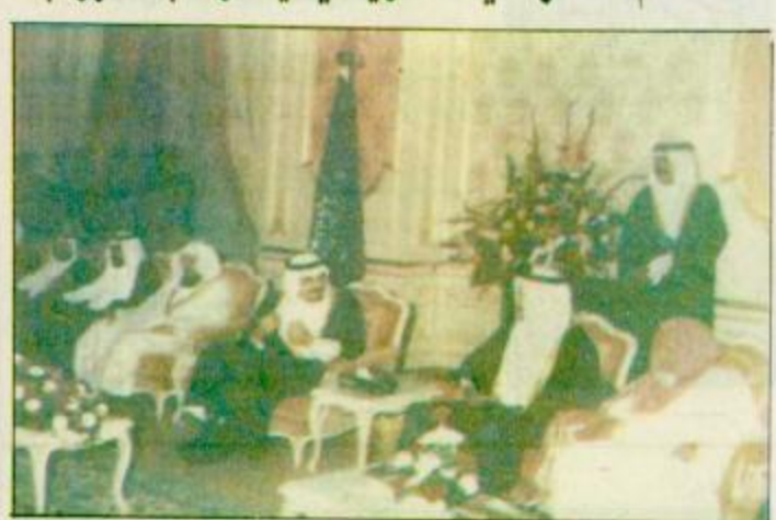
خادم الحرمين الشريفين لدى استقباله المواطنين اسن

تلقى خادم الحرمين الشريفين الملك فهد بن عبد العزيز آل سعود رسالة من فخامة الرئيس وليم ج. كلينتون رئيس الولايات المتحدة الأمريكية فيما يلي خادم الحرمين الشريفين: نيابة عن شعب الولايات المتحدة الأمريكية أهني «الملكة العربية السعودية بمناسبة اليوم الوطني. أهني «عنتر الملكة العربية السعودية خليفة حميدة في المجتمع الدولي وداعمة