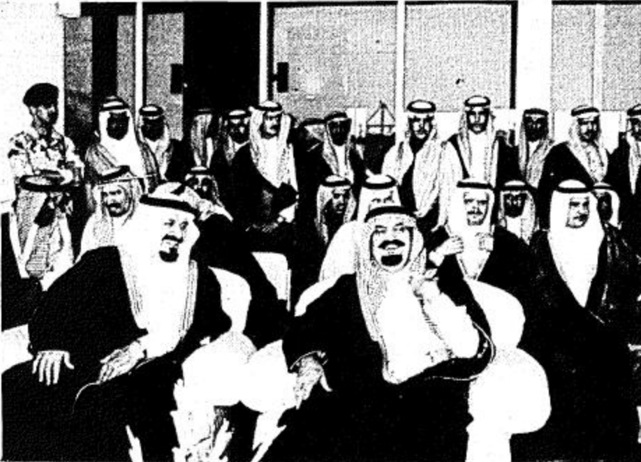
التعبير: بأفلام الحرمين الشريفين لكم من ملككم التاريخي القيمة على فديتكم الحنين وراثتكم الفريدة العربية