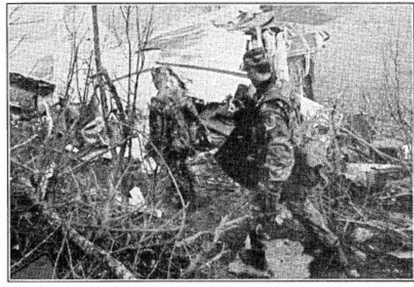
دوبروفنيك كرواتيا (أ ف ب): ثلاثون من محققي الجيش الأمريكي يفحصان ما بقي من حطام الطائرة الأمريكية العسكرية T43 التي سقطت متهتمة يوم الأربعاء الماضي وهي تحاول الهبوط بمطار دوبروفنيك بكرواتيا وعلى متنها ٣١ ركاباً من بينهم وزير التجارة الأمريكي براون برون.

البحرين: قند الرئيس المصري حسني مبارك الرئيس الفرنسي جاك شيراك في اليوم الأول لزيارته الرسمية الأولى في مصر التي وصلها يوم السبت قادماً من بيروت على وسام مصري هو قلابه للثقل. وكان رئيساً من الجانب المصري الفرنسي ستانوا عملية السلام في الشرق الأوسط والمؤتمر الاقتصادي الاقليمي الثالث الذي سستضيفه القاهرة في تشرين الثاني/ نوفمبر المقبل والعلاقات الثنائية بين البلدين.