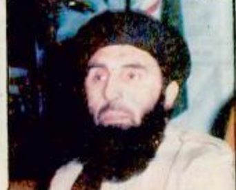
البحرية ص ٢٢

صرخ احد الافغان الغاضبين عندما رأى صحفياً اجنبياً قاتلاً ان الطرفين يريدان السلطة. وقد بدأت الهدنة التي انتهت ثلاثة اسابيع من القتال بين القوات الموالية للحكومة الائتلافية الاسلامية ومقاتلي الحزب الاسلامي ظهر يوم السبت الماضي.