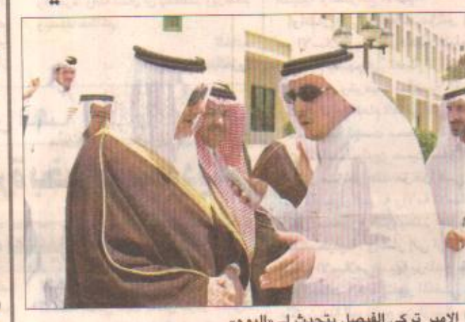
الأمير تركي الفيصل يتحدث لـ «اليوم»

شاه الله وعن رؤيته لجائزة سمو الأمير محمد بن فهد بن عبدالعزيز للتفوق العلمي وعدي إسهاماتها في تشجيع التفائق والتحصيل العلمي رأى سموه أن هذه الجائزة عظيمة ورائدة فيما تقوم به من تكريم المبرزين في العلوم في جميع القطاعات التعليمية بالمنطقة الشرقية. وقال سمو الأمير تركي الفيصل: لقد سمعنا في حفل هذه الليلة أن معهد الإدارة أصبح هذا العام لهذه الجائزة وكل سنة يخاف للجائزة قطاع تعليمي جديد مفيد سموه أن هذا العمل يعد فريداً من نوعه وإن شاء الله ستكون نتائجه جيدة للمجتمع. من جهة أخرى أكد سموه ووقوف المملكة جنباً إلى جنب مع إخواننا في فلسطين وأشاد سموه في تصريح لـ