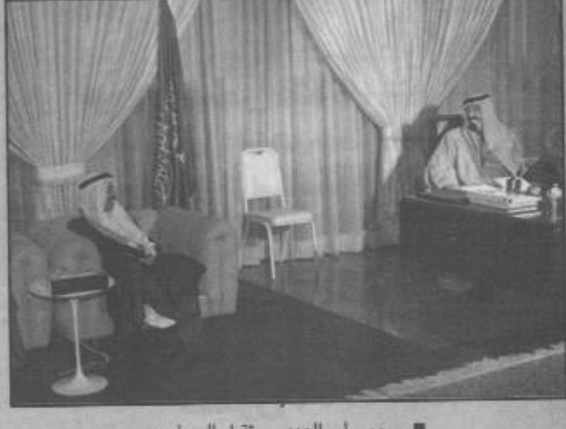
سمو ولي العهد يستقبل السرياني