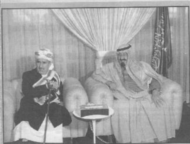
سمو ولي العهد يستقبل رئيس مجلس النواب اليمني