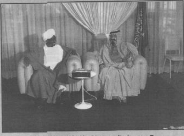
سمو ولي العهد يستقبل نائب الرئيس السوداني