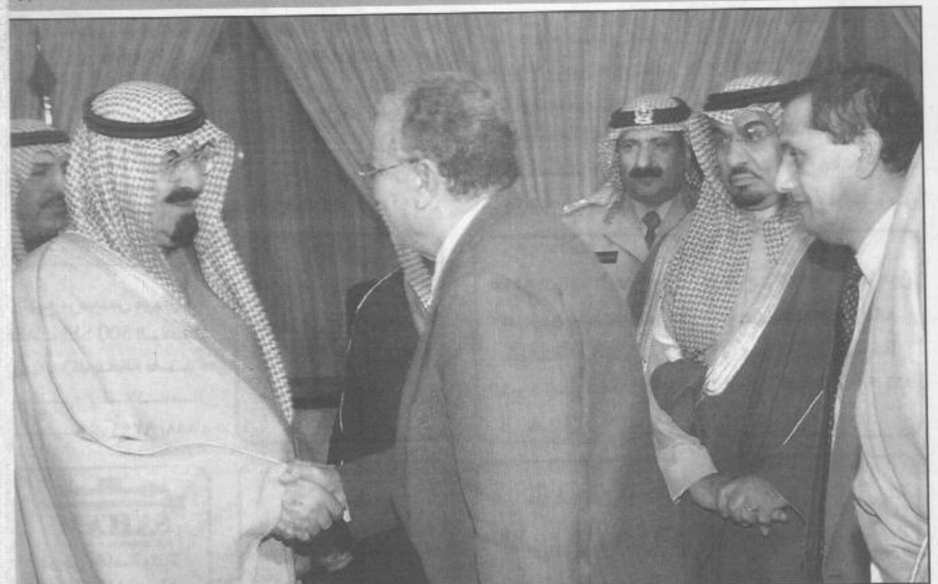
سمو ولي العهد خلال استقباله وزراء الثقافة