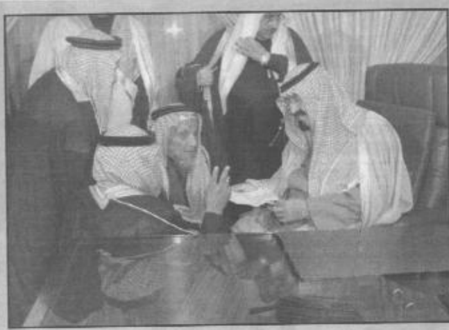
سمو ولي العهد يستقبل المواطنين