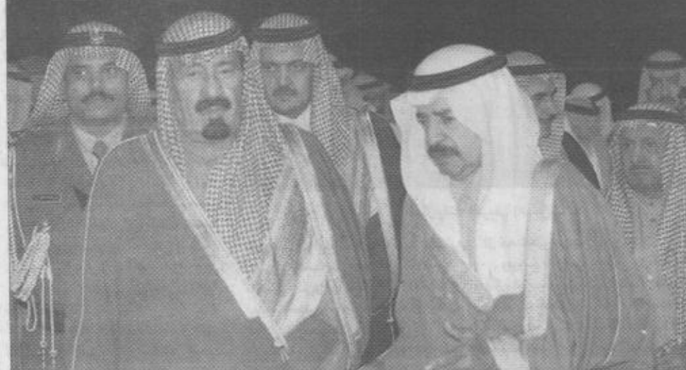
سمو ولي العهد يعزي رئيس وزراء البحرين

رئيس الوزراء والشيخ محمد ابن عيسى آل خليفة والفرق اول خليفة بن احمد ابن سلمان وزير الدفاع والشيخ علي ابن خليفة بن سلمان آل خليفة وزير المواصلات وصاحب السمو الملكي الامير سعود بن عبدالعزيز وسفير خادم الحرمين الشريفين في البحرين عبدالله آل الشيخ واصحاب المعالي الوزراء وكبار المسؤولين من مدينتي وعسكريين بدولة البحرين.