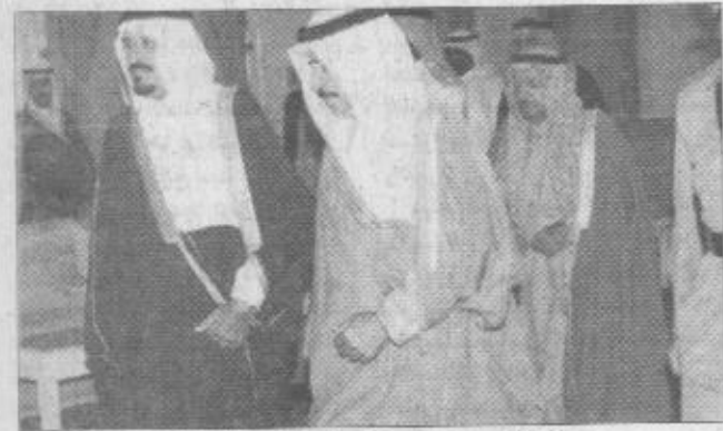
سمو الأمير سلطان بن عبدالعزيز الثاني