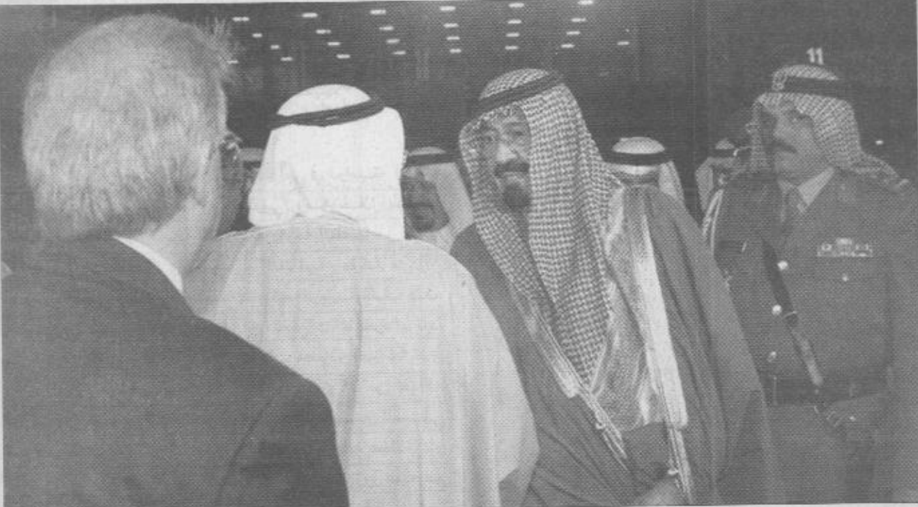
سمو ولي العهد يعزي المسؤولين البحرينيين